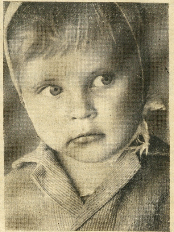
Фотоэтиюд Б. Серова, электрика ткацкой фабрики.