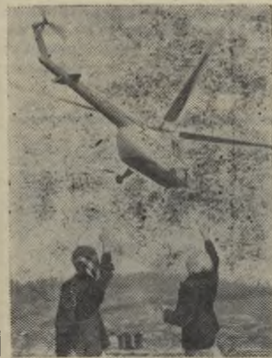
На снимке: вертолет отправляется с пассажирами из таежного поселка лесозаготовителей Большой Унгут Манского района Красноярского края в гор. Красноярск.

Самые отдаленные уголки—бывшие «медвежьи углы», как их называли раньше, благодаря авиации стали близкими.