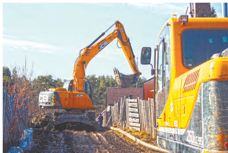
На деревенской улице работает тяжелая техника.

Учитывая разницу в стоимости дров, электричества и газа, затраты окупаются за полтора-два года. К тому же определенным категориям жителей Свердловской области предоставляются субсидии из регионального бюджета. В числе льготников — многодетные и малоимущие, одинокие и пожилые, ветераны Великой Отечественной войны, участники СВО и члены их семей, медицинские работники, педагоги. Размер компенсации — от 100 до 250 тысяч рублей—покрывает до 90 процентов вложений собственников.