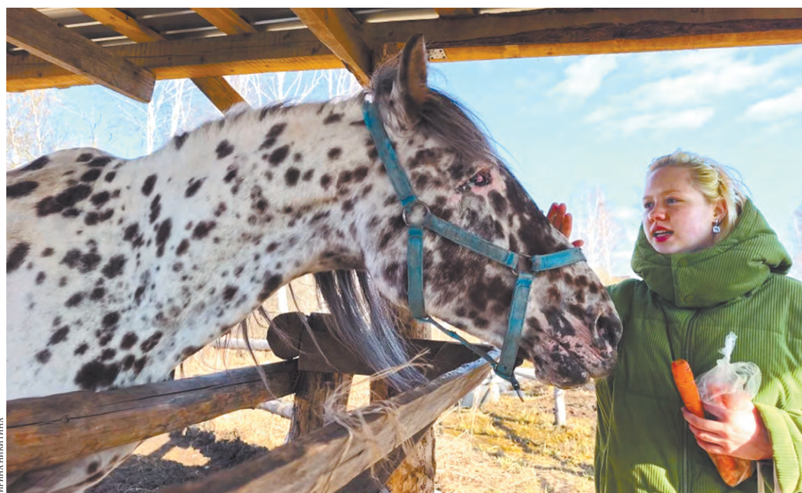
Джонни слепой. В приюте ему покупают нарядные попоны, угощают мюсли, гладят и целуют.