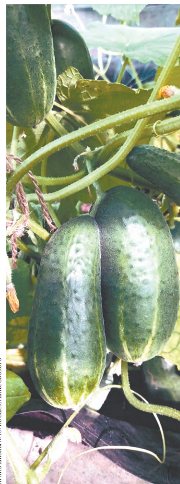
Огуртык—гибрид тыквы и огурца.