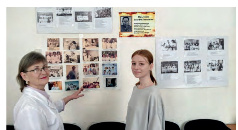
Дети войны. Солдатский привал. Школьный парк Зайковской СОШ №2.

«Они вернулись ночью, радостные, уставшие, но шумные и довольные. «Чего удумали? На фронт?» А они годочков прибавили и вот она, бумажка: «Явиться на станцию Худяково...» Утром - отправка. Печь затопила, блинов завела, а ребят разморило. Уснули голые, намалялся за день. Чуть свет - разбудила: «В баню идите, печки заслонкой стучат, а чуеунку пустой. С вечера картошку съели».