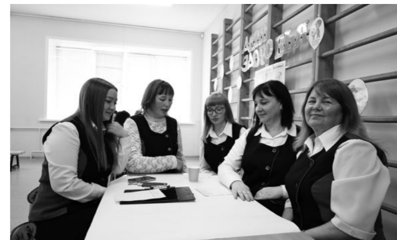
Команда детского сада «Жар-птица».

Методические разработки воспитатели не оставили равно-