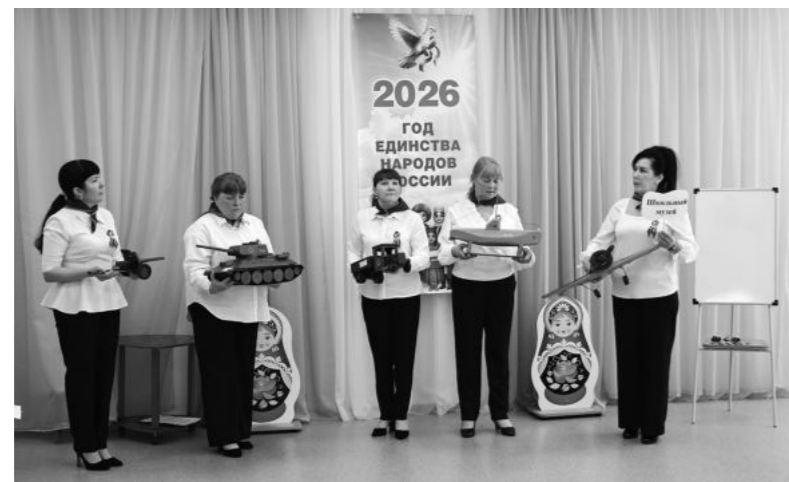
Команда Знаменского детского сада представляет проект, посвященный Дню Победы.

На втором этапе командам нужно было представить в течение 10 минут свой интегрированный образовательный маршрут на неделю