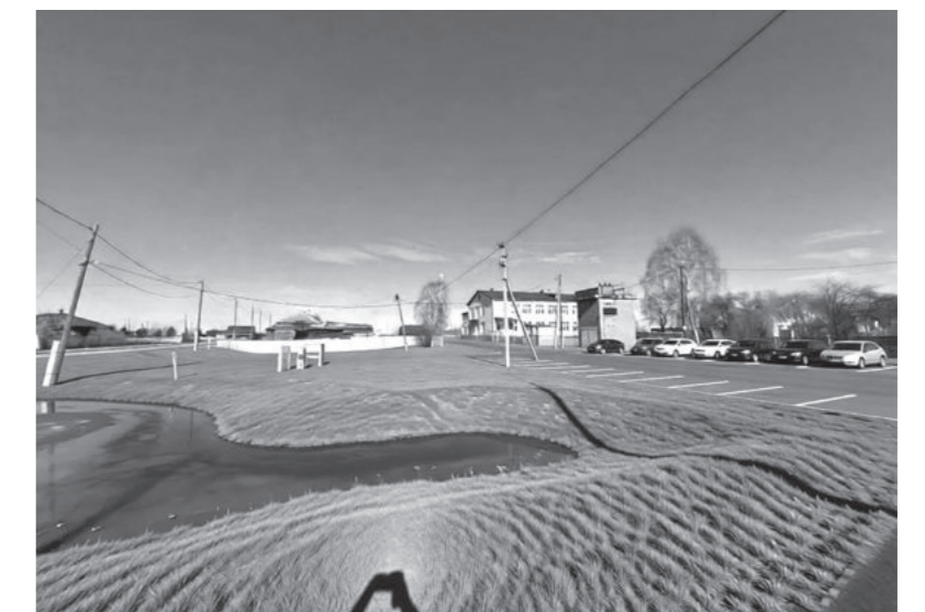
Село Килачевское, улица Ленина.