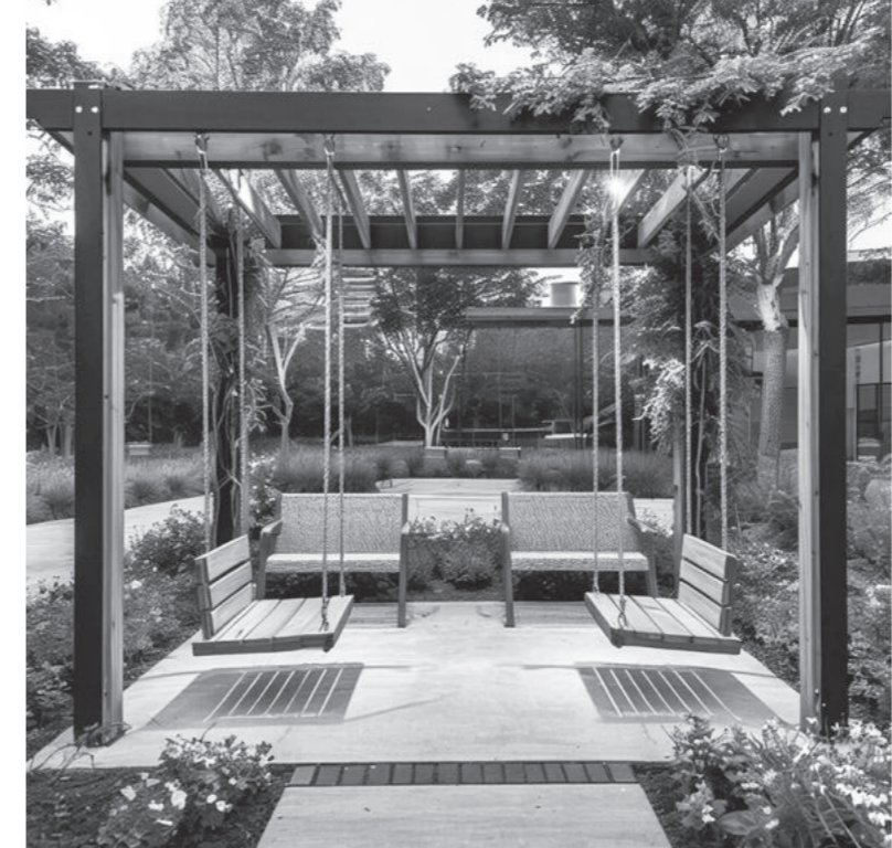
Село Ключи, улица Урицкого.