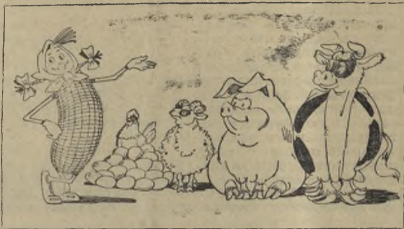
— Моя работа — полюбитесь!