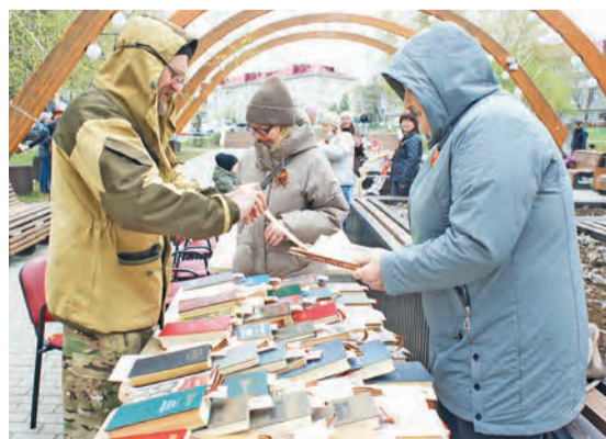
Акция библиотекарей «Весна Победы»