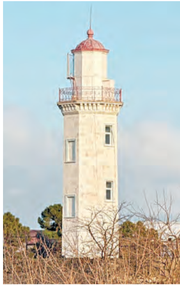
Действующий маяк, построенный в 1866 году

В Дербенте есть действующий маяк, построенный в 1866 году. Он является самым старым в России и включен в