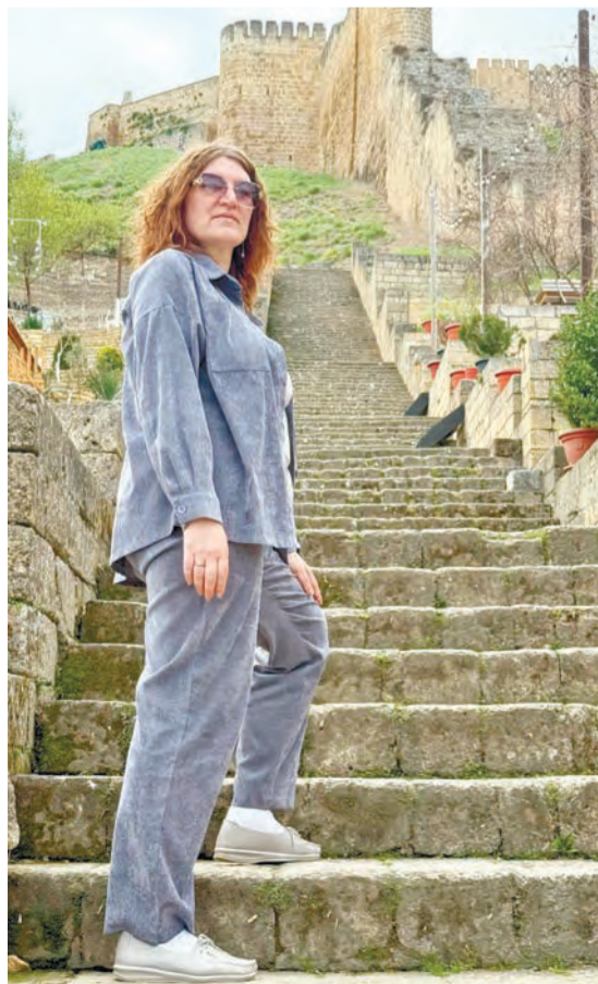
232 ступени цитадели «Нарын Кала»