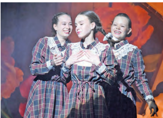
Концерт во Дворце культуры