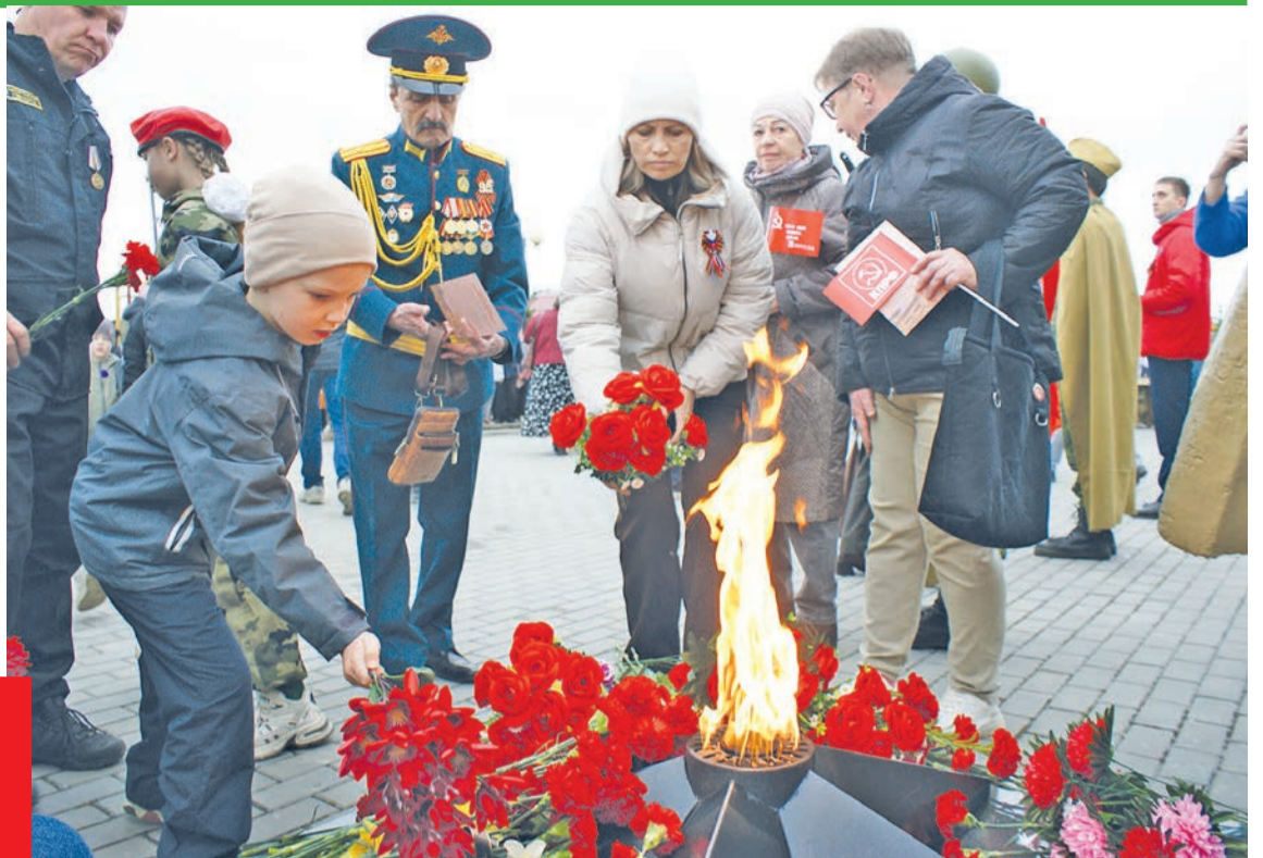
Возложение цветов к мемориалу в Валериановске