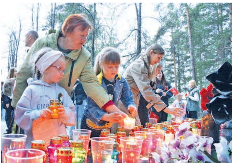
Качканарцы зажгли свечи в память о погибших героях