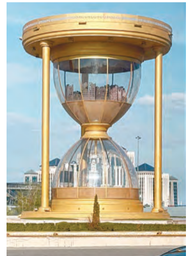
Символическая инсталляция на въезде в Грозный

В Чечне достаточно строгие нормы поведения, на улицах нет мусора. Там не принято курить в обще-