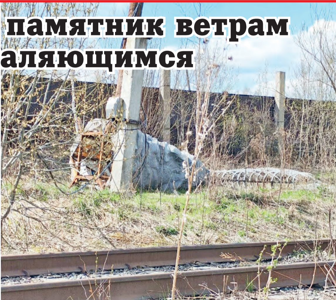
Фото жительницы города

И вот в начале мая жительница города проезжала мимо промышленной зоны и обнаружила около одного из зданий тот самый арт-объект заброшенным.