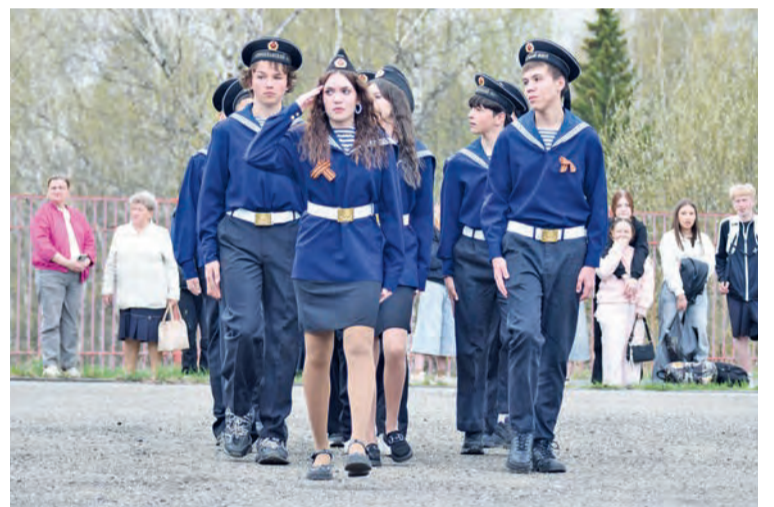
Выступление школы №4 на смотре строя и песни