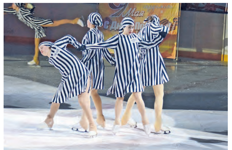
Ледовое шоу «Была война... Была Победа...» из Лесного