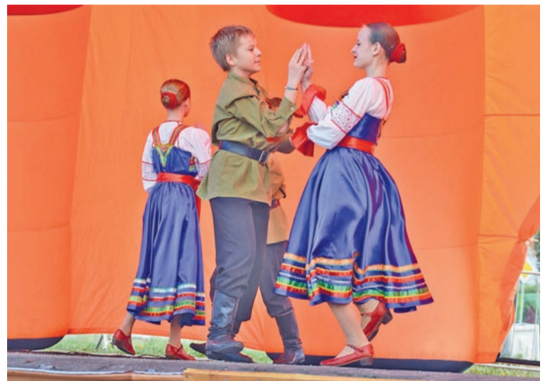
Образцово-хореографическая студия «Радость» с творческим номером