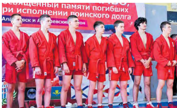
▲ Парад участников