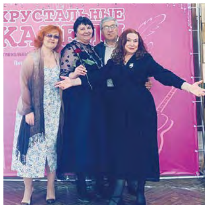
▲ Команда «Цветов добра» в Реже