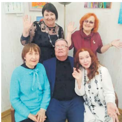
▲ «Время творить добро», г. Екатеринбург