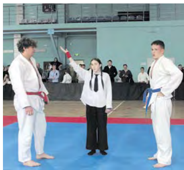
▲ В соревнованиях приняли участие около ста спортсменов

23-24 апреля на территории оперативного обслуживания МО МВД России «Алапаевский» проводился первый этап оперативно-профилактического мероприятия «Иностранец». Основная цель - предупреждение и пресечение преступлений и административных правонарушений в сфере миграции.