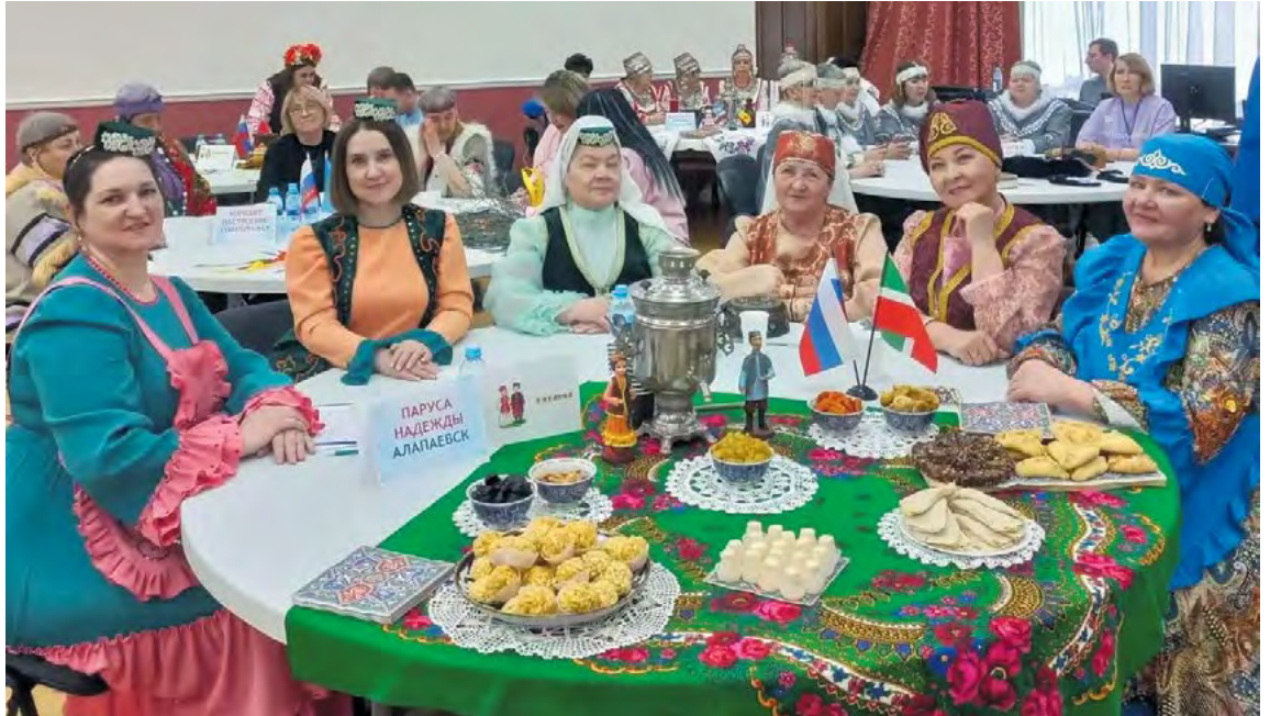
▲ Команда Алапаевска за щедрым столом