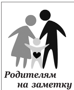
Родителям на заметку