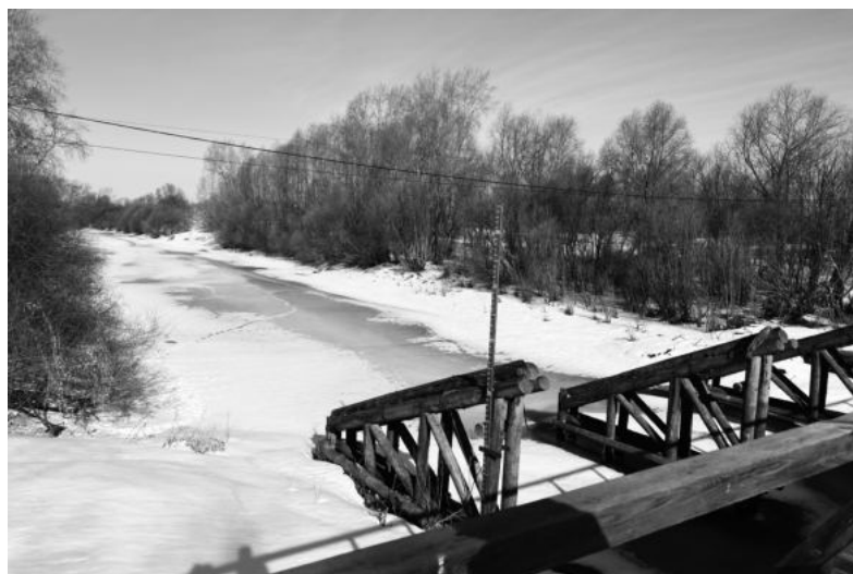
Мост, д. Юдина.