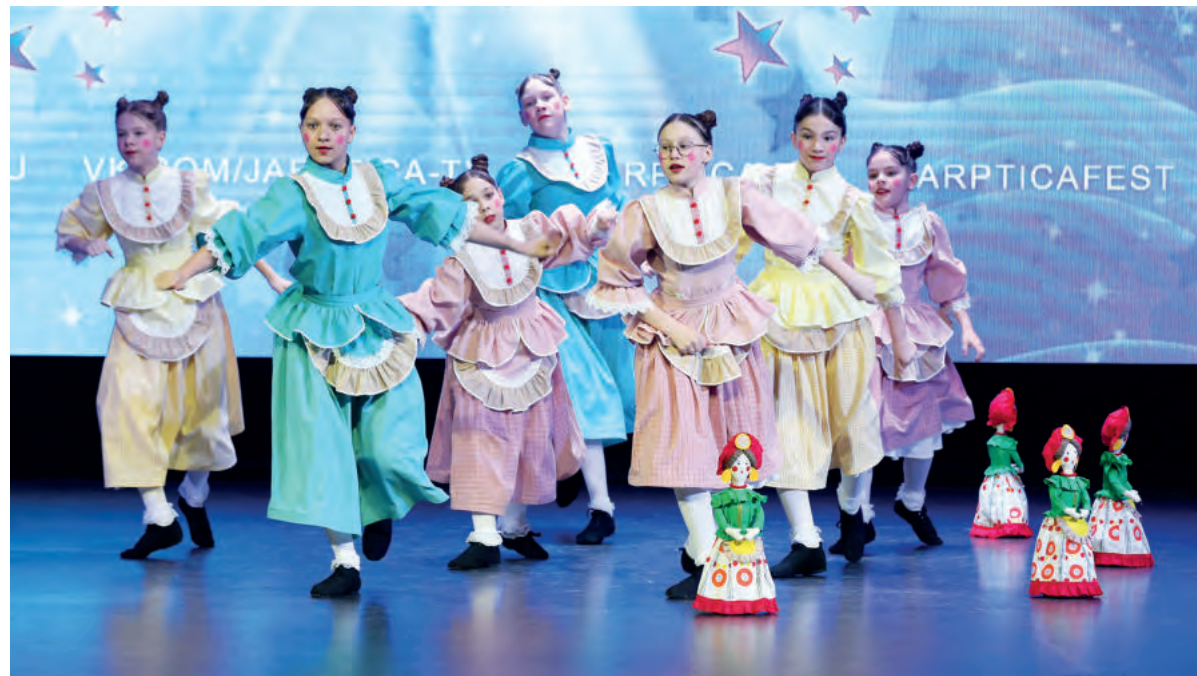
Образцовый хореографический коллектив «Калейдоскоп».

ЕЛЕНА БАЛАКИНА