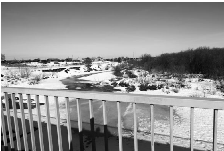
Мост, д. Симанова.