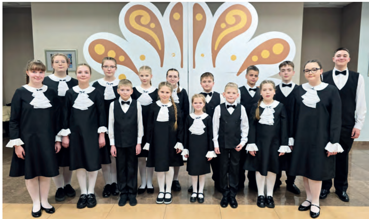
Сводный хор «Доминанта».

Творческие коллективы Ирбитской районной школы искусств успешно выступили на международном фестивале-конкурсе «Звездная россыпь», собравшем сотни участников от Забайкальского края до Санкт-Петербурга.