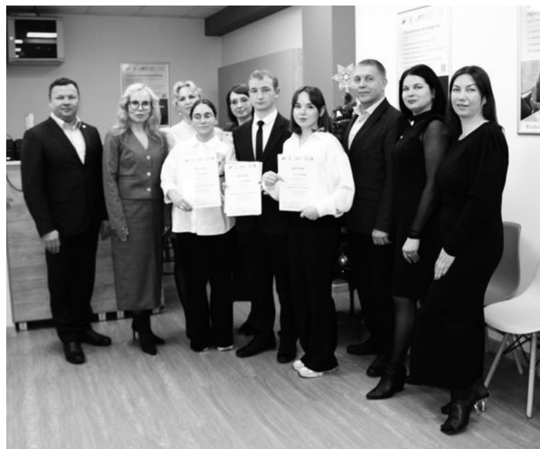
Школа бизнеса для учащихся.

В прошлом году фонд оказал 101 консультацию (при плановом показателе 95) 60 субъектам малого и среднего предпринимательства и самозанятым по темам: финансовая поддержка