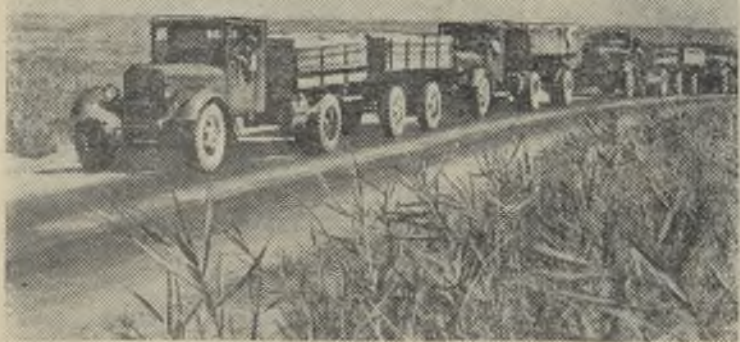
Алма-Атинская область. Колхозы и совхозы наращивают темпы вывозки зерна на государственные заготовительные пункты. Тысячи автомашин заняты перевозкой хлеба нового урожая.