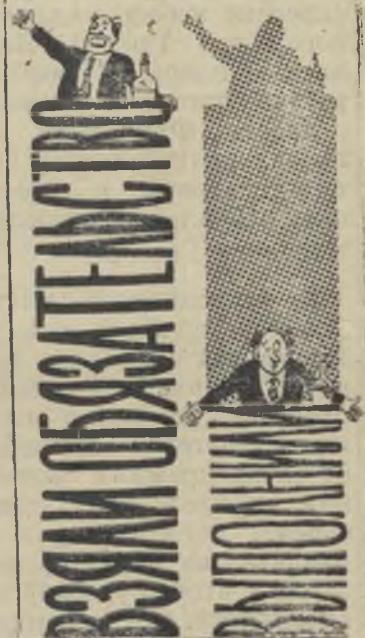
Слова и дела руководителя колхоза имени Калинина.

Поголовье свиней в артели в 1959 году по сравне-