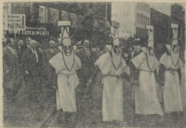
Федеративная Республика Германии. В середине июня в Ганновере (Саксония) состоялась массовая демонстрация протеста против атомного вооружения бундесвера, в которой приняло участие свыше 40 тысяч человек. Демонстрация была организована местным комитетом «борьбы против атомной смерти» накануне обсуждения в ландтаге земли Нижняя Саксония законопроекта о проведении народного опроса об атомном вооружении.

На снимке: колонна демонстрантов. Во втором ряду идут четыре министра земли Нижняя Саксония.