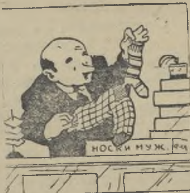
Рис. М. Ушаца и К. Невлера. Прескляше ТАСС.