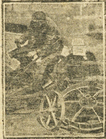
Приступили к ремонту посевных и уборочных машин.

Селькор Кайгородов делится опытом подготовки к севу на Андреевском сельсовете:—У нас созданы обменные бригады из колхозников по выявлению семян. В результате выявлено скрытого хлеба 130 центнеров. Процент выполнения плана за-