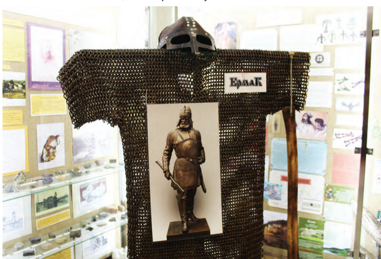
Увеличенная копия кольчуги Ермака

Еще больше новостей на сайте KRSGAZETA.RU