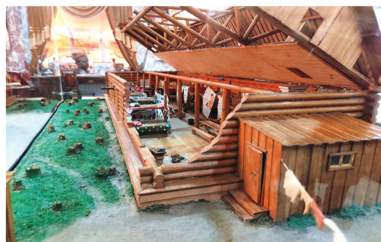
Макет барака, где жили первостроители КМК

Такая история хранится и в других залах, экспонатах, макетах, экспозициях музея. Здесь четко прослеживаются военный и послевоенный периоды, хрущевская оттепель, годы реформ, перестройка, но-