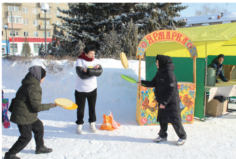
Развлечение с блинами

На площади работали ярмарочные ряды, где можно было приобрести сувениры ручной работы и попробовать угощения.