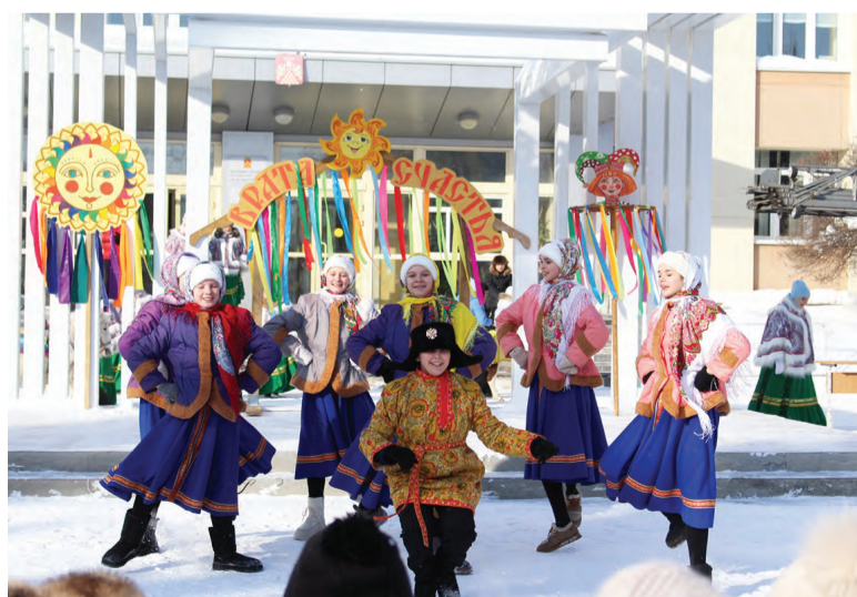
Танцевальный коллектив «Марион»

Рядом с импровизированной сценой развернулись интерактивные площадки для детей и взрослых, организованные активистами-волонтерами из молодежного общественного объединения «СОЮЗ