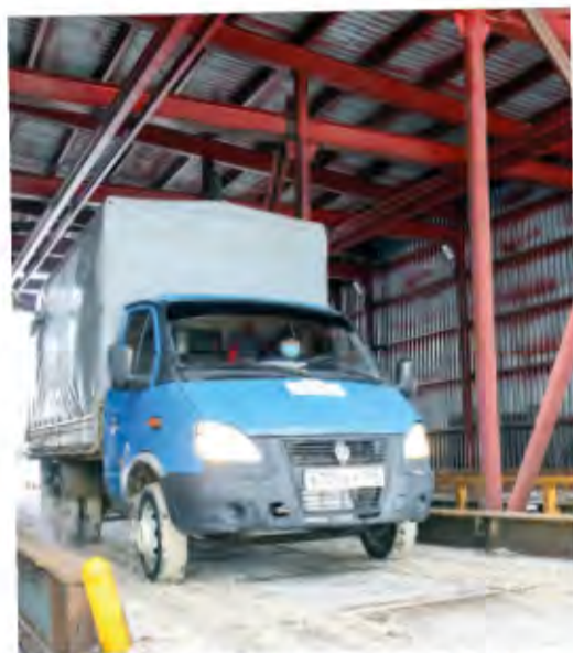
Через автомобильную весовую провозят тонны всевозможных грузов

В штатном расписании цеха числятся грузчики, кладовщики, весовщики, операторы ГСМ и мастера, кон-