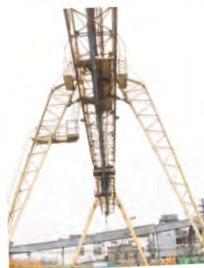
Новый козловой кран – надёжный помощник складских работников

Примечательно, что цех №49 все знает как склады, но здесь есть и производственные участки, где занимаются отгрузкой готовой продукции. Грузят в вагоны калий, флюс, шламоэлектролитную смесь и отправляют потребителям. И объёмы отгрузки растут: в 2025 году погрузили в два раза больше вагонов, чем в 2024. А среднее количество автомобилей с загруженной готовой продукцией составляет 450 в год.