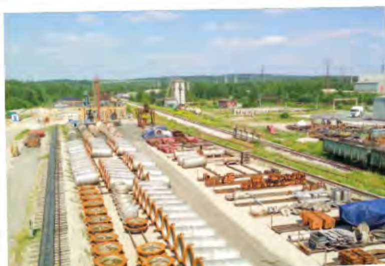
Хранить ТМЦ можно как на закрытых складах, так и на открытых площадках