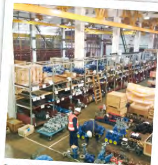
В цехе №49 ведут учёт свыше 8 тысяч номенклатур товарно-материальных ценностей (ТМЦ)