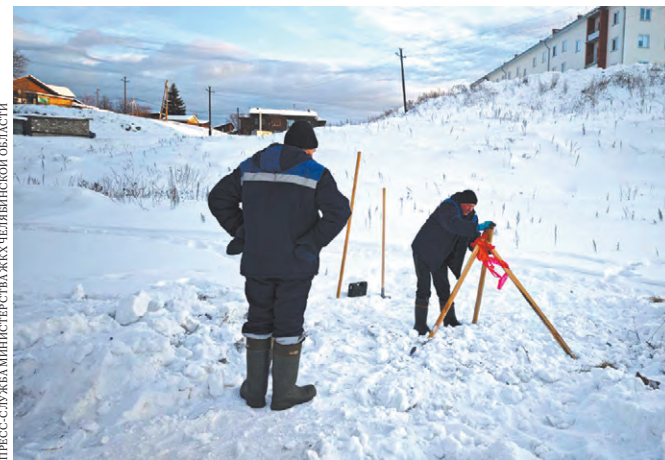
На Южном Урале проведут полную инвентаризацию объектов коммунальной инфраструктуры.