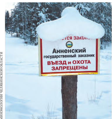
МИНЕКОЛОГИИ ЧЕЛЯБИНСКОЙ ОБЛАСТИ