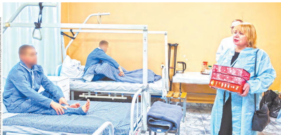
Свердловские нотариусы приходят к раненым бойцам, чтобы помочь им в юридических делах и проявить простое человеческое участие.