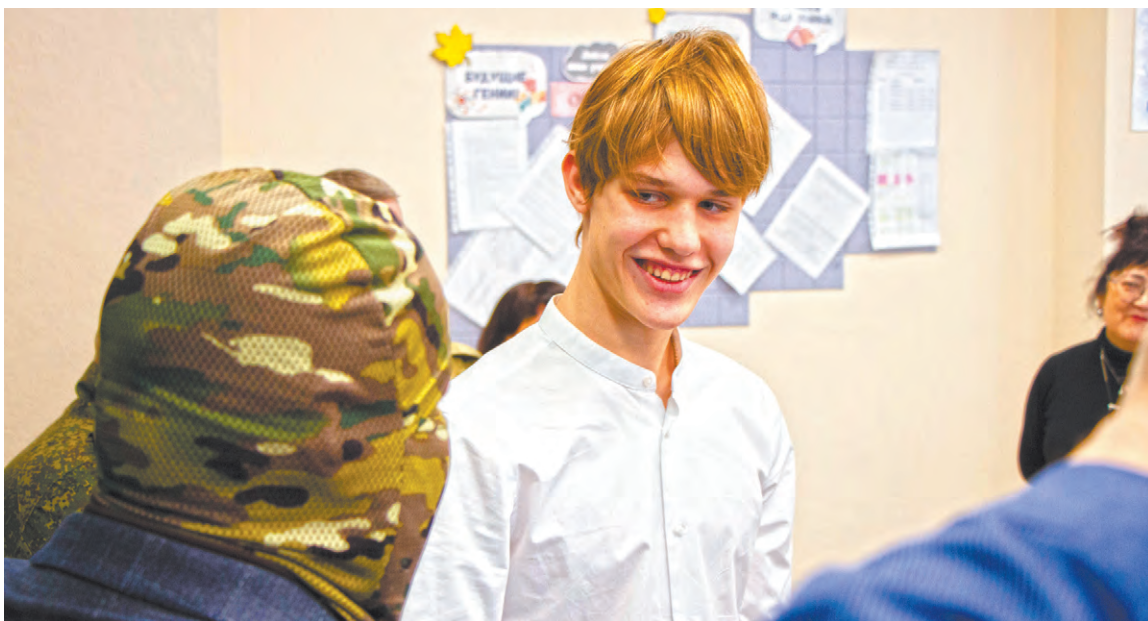
ПРЕСС-СЛУЖБА АДМИНИСТРАЦИИ КУРГАНА