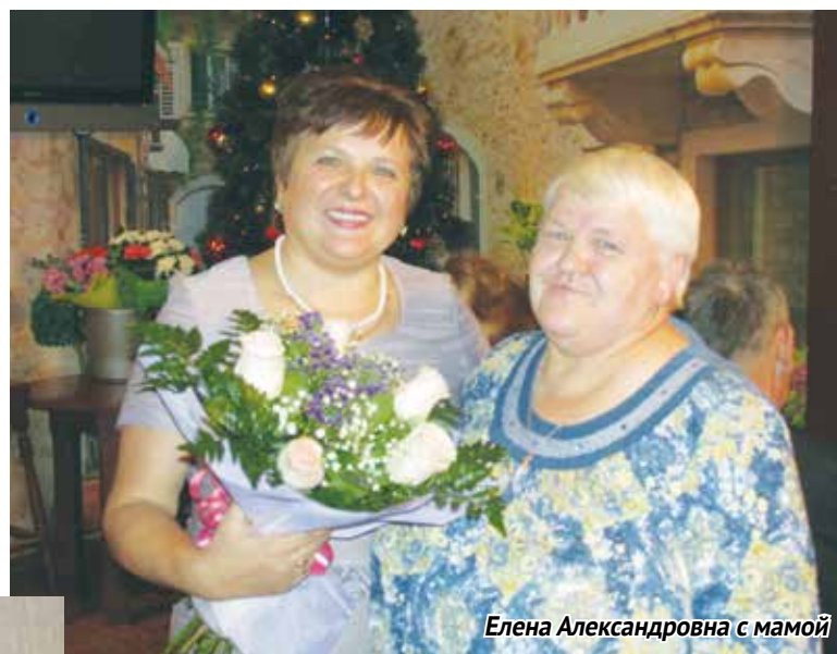
Елена Александровна с мамой