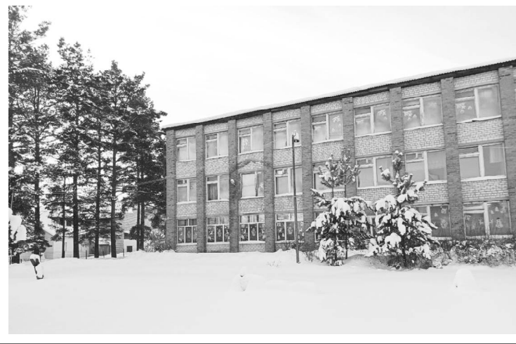
История. Память. Общество. Человек.

Отметим, что специалисты «Россети Урал» проводят системную работу по выносу ЛЭП с территорий образовательных учреждений в рамках программы по снижению рисков травматизма на энергообъектах.