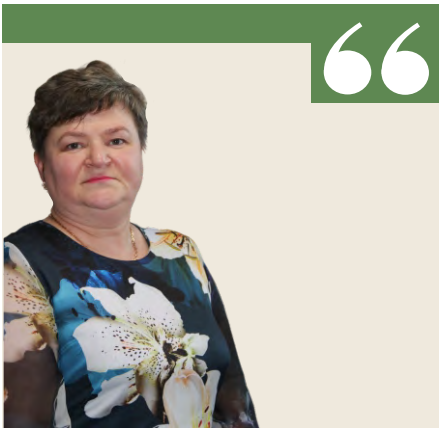
Председатель Думы МО Пелым