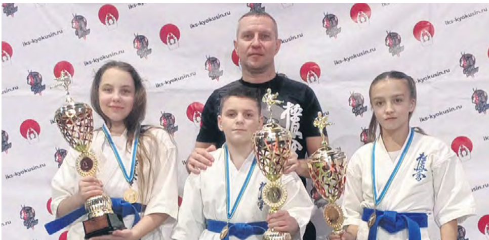
Ревдинские спортсмены внесли большой вклад в медальную копилку сборной Свердловской области.

Ревдинские спортсмены внесли большой вклад в медальную копилку сборной Свердловской области, которая в итоге заняла первое командное место на чемпионате и первенстве УРФО по карате киокусинкай.