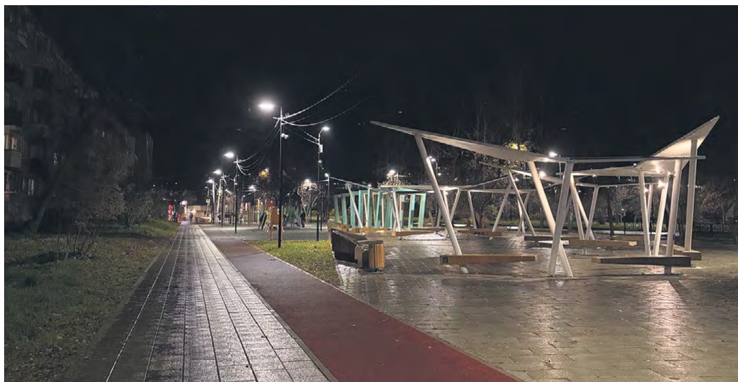
Поздняя ночь, все уже давно пытаются спать, но для жителей дома 41 по улице Чехова — это не так просто, так как под их окнами располагается Молодёжный сквер. // Фото Александра Семкова

Периодически в полицию поступают сигналы о несовершеннолетних, нарушающих комендантский час. В этом случае полиция передаёт подростков родителям, а материалы передаются в территориальную комиссию по делам несовершеннолетних и защите их прав. На жалобы о шумных компаниях постарше выезжают уже согласно закону о соблюдении тишины с 23:00 до 08:00, за что родителям, либо подростку с 18 лет могут грозить штрафы.