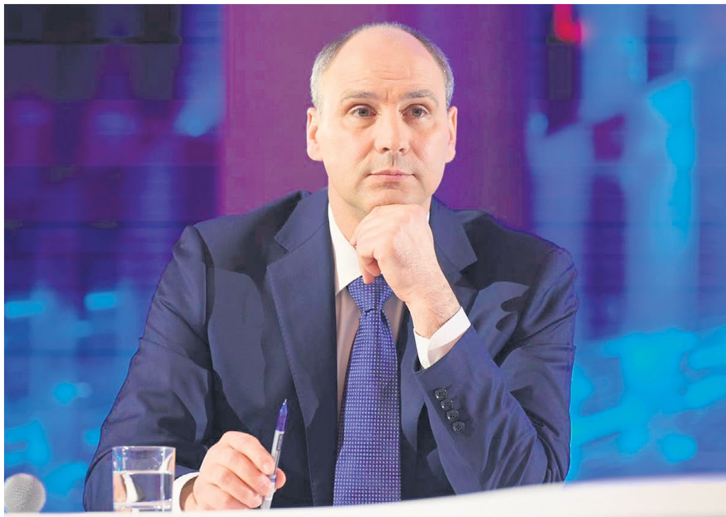
Прямая линия — один из самых эффективных форматов общения с жителями.

— Педагоги — очень значимая и весомая часть нашего общества. На их плечах сложная задача по воспитанию и образованию. Но самое сложное — это воспитать молодежь будущего среди активно развивающихся технологий. Педагог закладывает этот фундамент на десятилетия. И те конфликтные ситуации, которые возникают, должны решаться диалогом между поколениями.