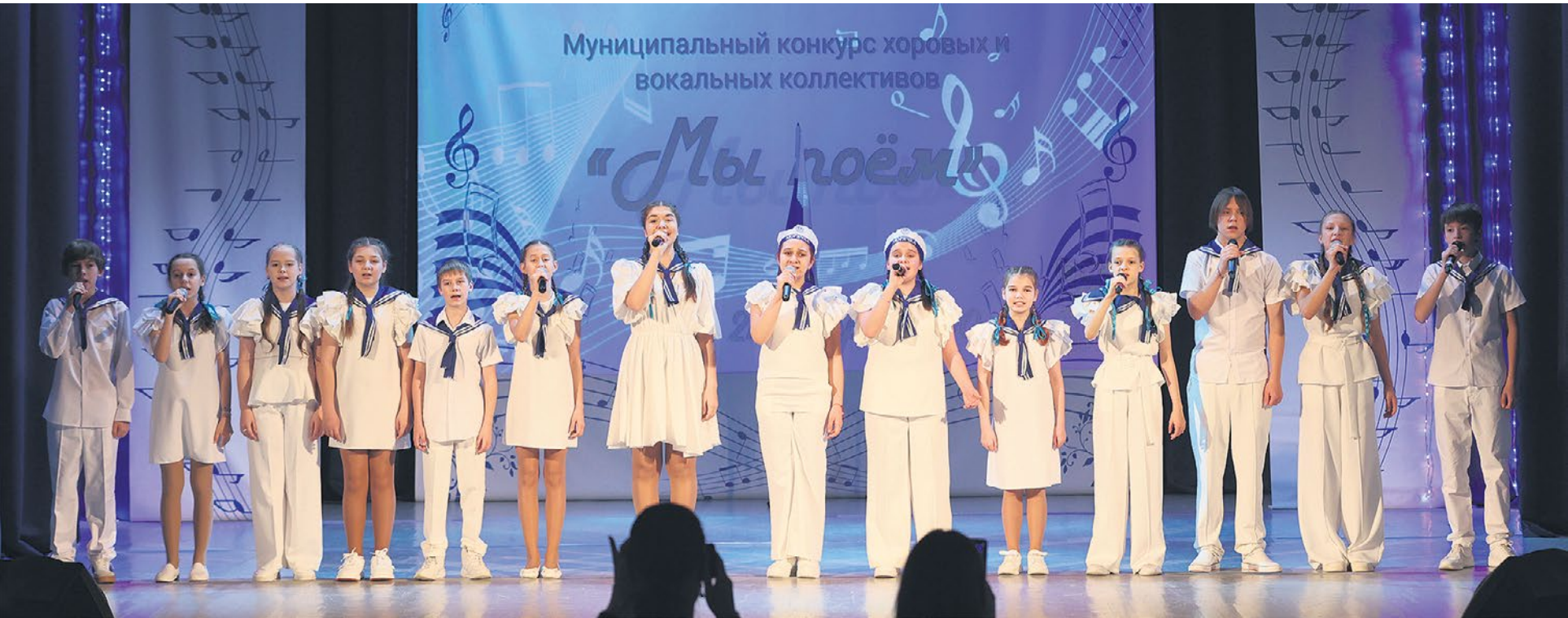
Хор «Созвездие» гимназии №25 стал единственным школьным хором, вышедшим на региональный этап вокального конкурса.

А мы желаем всем ревдинским вокалистам удачи на новом этапе.