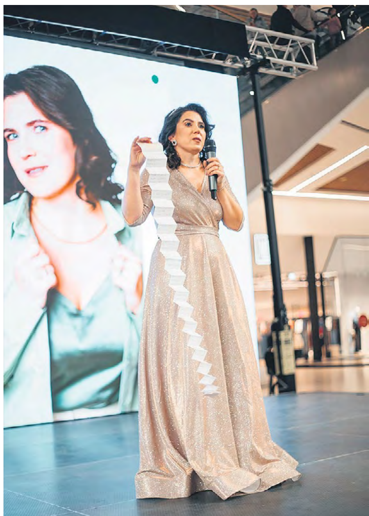
В финале конкурса участникам нужно было представить три задания. В визитной карточке, к примеру, мамам нужно было поблагодарить себя.