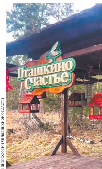
Птичий ресторан стилизован под сказочную избушку.