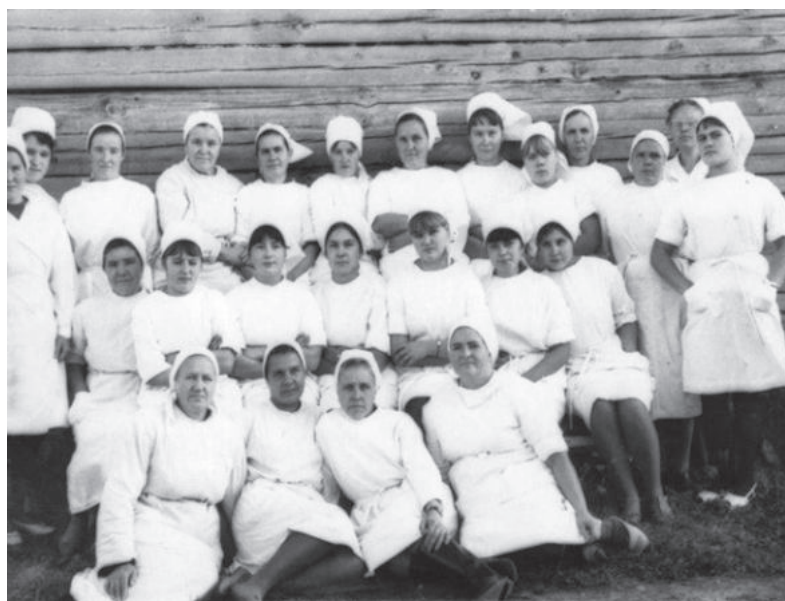
Коллектив больницы в Скородуме.

Людмила Овчинникова, п. Зайково