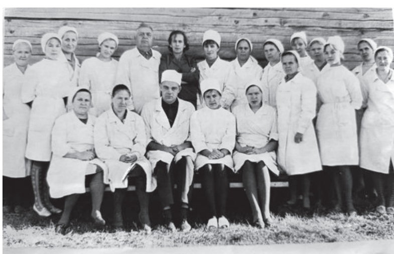
Коллектив в 1960-е годы.