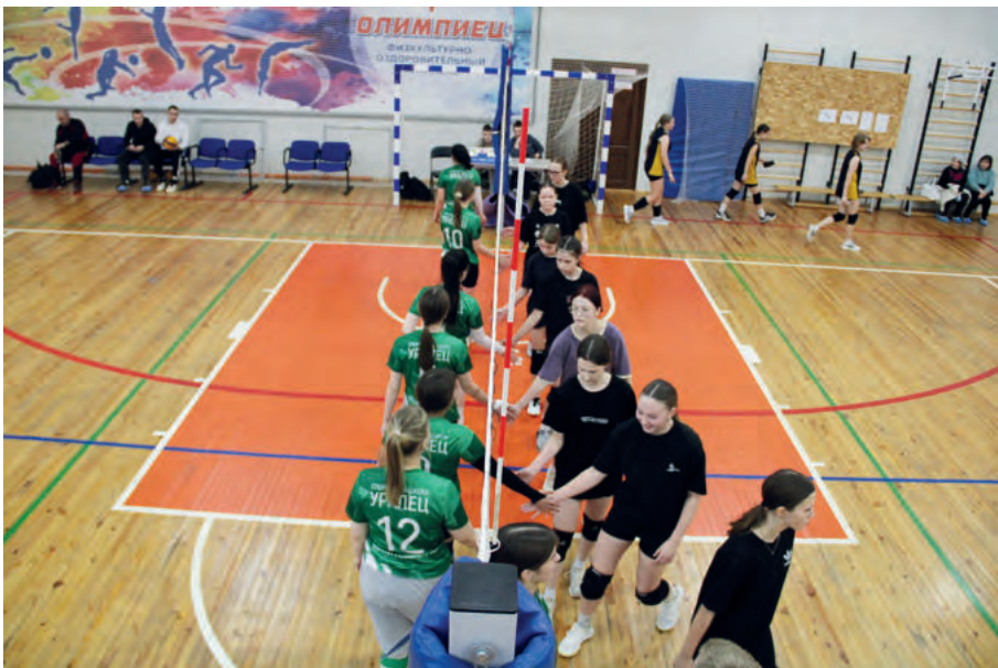
Традиционное приветствие команд.

В турнире команды играли в двух подгруппах. В первой сразились Пионерская, Ключевская, Знаменская и Килачевская школы, во второй - Черно-вская, Бердюгинская, Слободо-Туринская и Байкаловская школы. Каждая команда стремилась проявить лучшие качества. Их поддерживали верные болельщики, а наставники подсказы-