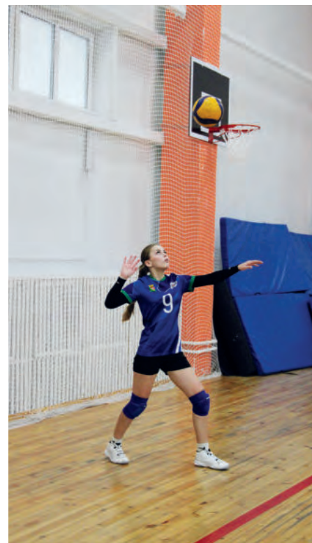
Уверенная подача – основа победы.