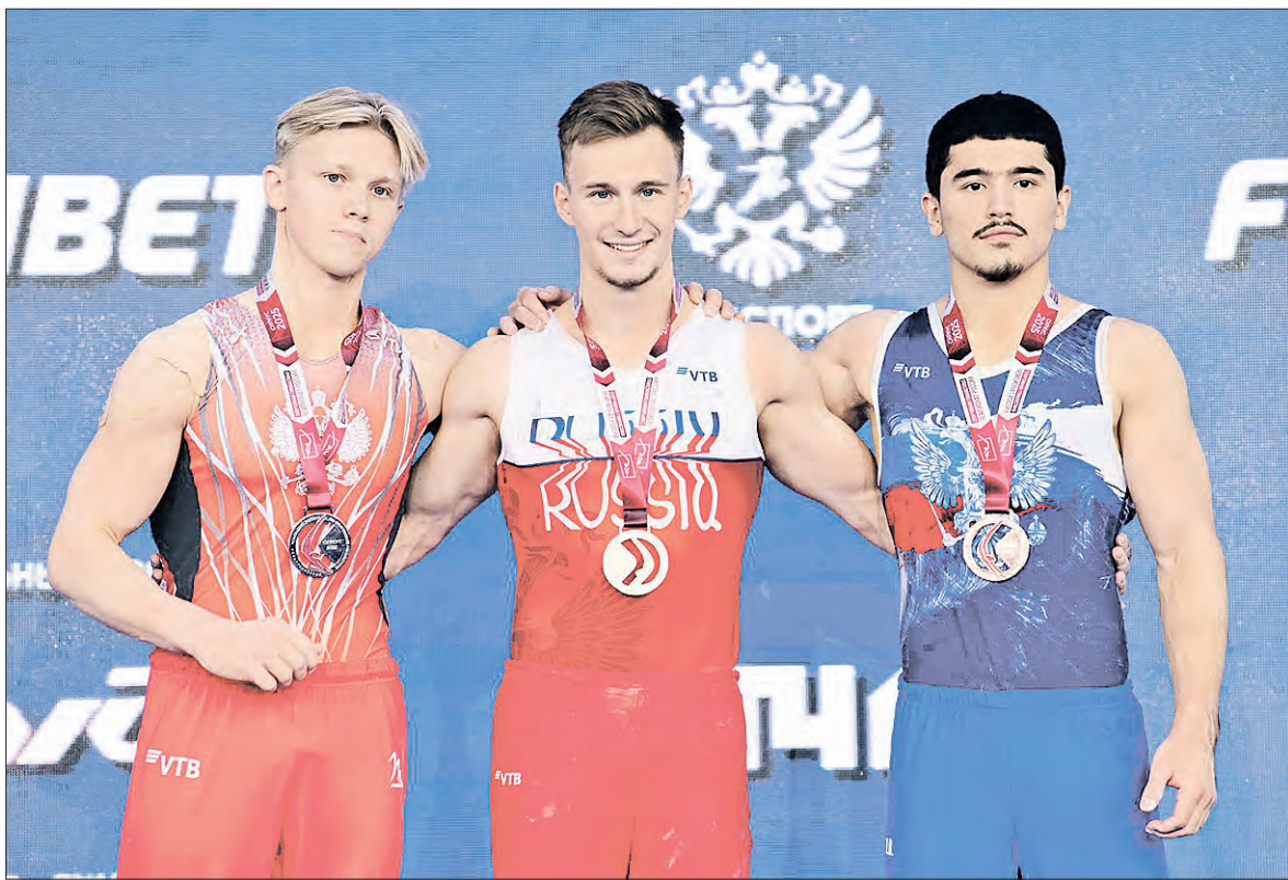
Фото ФТ Сириус Спортгим. ИР-2025