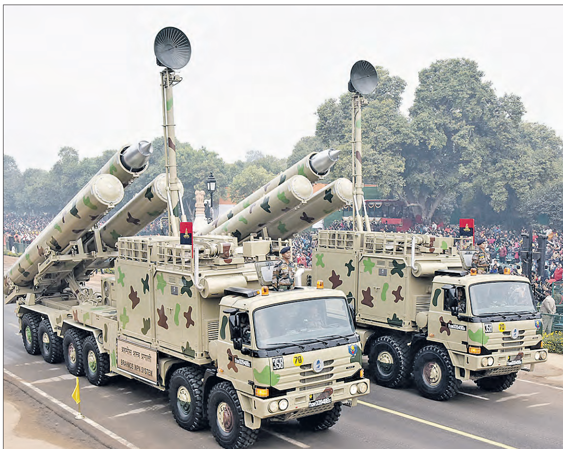
Индия располагает развитой оборонной промышленностью, которая способна производить многие виды современного вооружения для национальной армии

Демонстрируя стратегическую автономность Индии, премьер-министр этой великой державы Азид Нарендра Моди, опять-таки наперекор предостережениям США, направился с визитом в Китайскую Народную Республику, где принял участие в саммите ШОС. И это привело ведущие политические круги в Вашингтоне в ярость. Так,