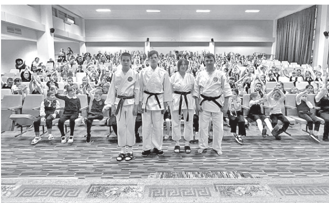
Показательные выступления помогают привлечь ребят к спорту

Ранее подобные мастер-классы артемовскими айкидоками проводились в 2023