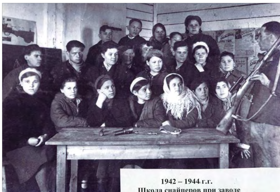
1942 – 1944 г.г. Школа снайперов при заводе

Уходя на призывной пункт, коллеги дали наказ: «Работайте, давайте для своей страны больше продукции, вооружайте Красную Армию, чтобы она не знала недостатка ни в чём. Помните, что вы в тылу, а мы на фронте вместе куём победу над фашизмом». Оставшиеся в цехах наказ выполнили.