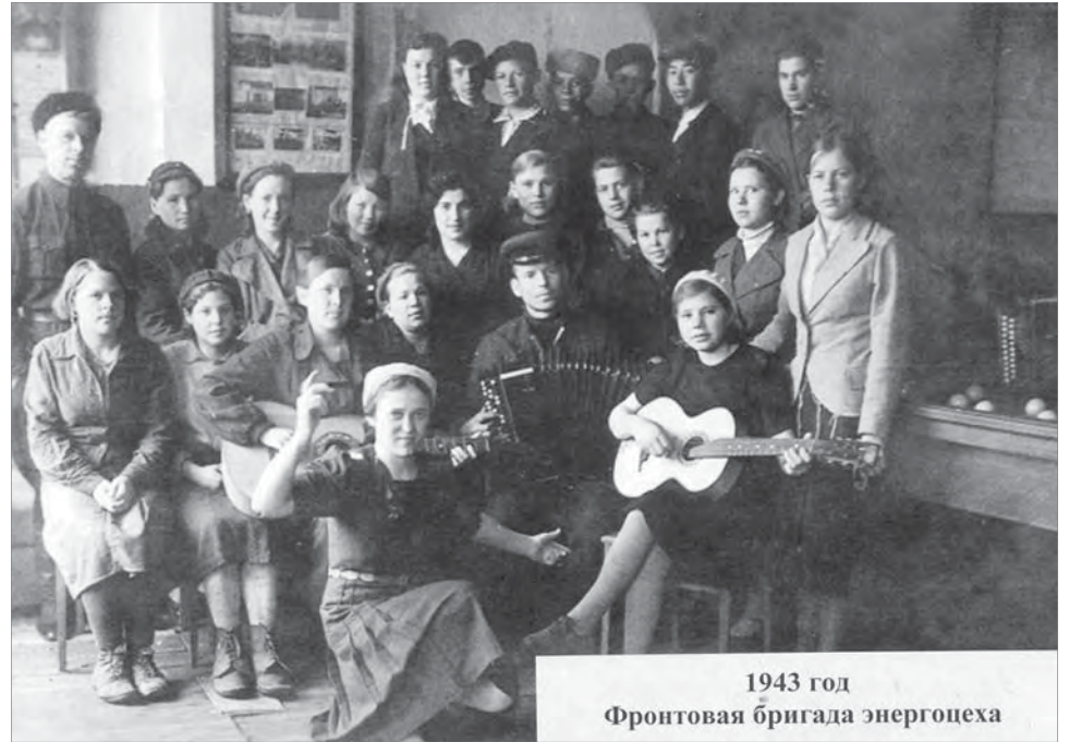
1943 год Фронтовая бригада энергоцеха