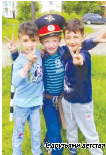
С друзьями детства

Я до последнего была уверена, что сына не примут в кадетскую школу. По здоровью мы проходи-