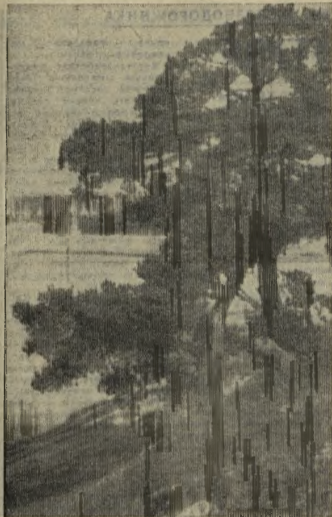
ЛЕТНИЙ ПЕЙЗАЖ.

—Хорошая вещь — автомобиль! Слов нет — удобная. И все же, рискуя вызвать усмешки, отдаю предпочтение велосипеду. Для него не нужно строить гараж, покупать топливо, искать дефицитных запасных частей.