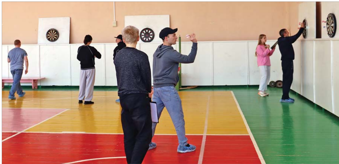
Игра в дартс среди заводчан очень популярна.

Командные результаты первенства опубликуем в следующем номере, после тщательного подсчёта и проверки всех данных организаторами.