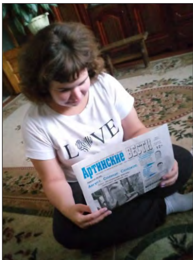
«Артинские вести» в любой позе интересны