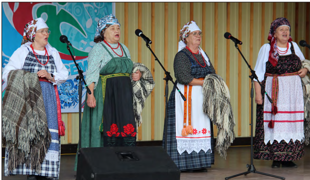
Народный ансамбль «Рябинушка»

Много языков, но каждый поет о любимой родине