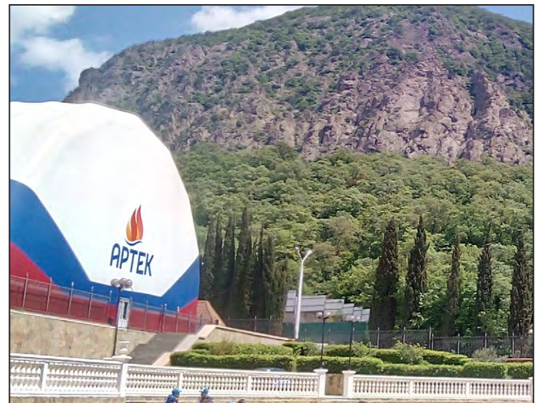
Вид на Аю-Даг и спортзал у входа в школу

сокий: когда нас забрали автобусы с базы, где нас осматривали и проверяли состояние здоровья, на въезде в сам «Артек» тщательно проверяли списки, пропуска у вожатых и сам автобус на наличие бомб или чего-то подобного. Кроме этого, у нас проводили учения по пожарной и воздушной тревоге.