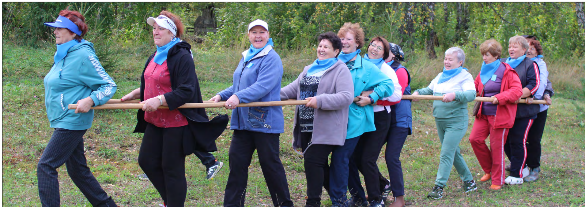
Слаженная работа команды в голубых галстуках