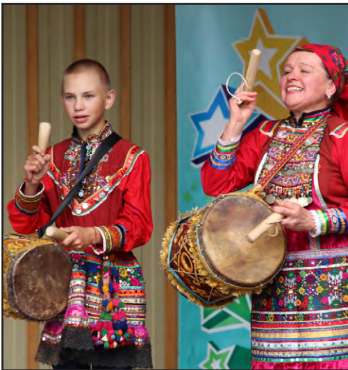
«Маленькая звездочка» из Малотавринского СДК