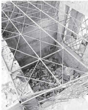
Чего только не скидывают в эту яму

ры, и это уже не первый год. Она пообещала, что сделают.