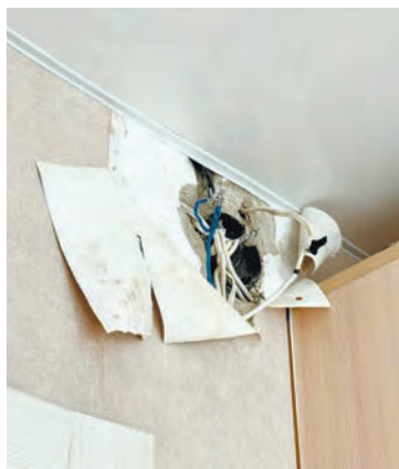
Электрик расковырял коробку и ушёл