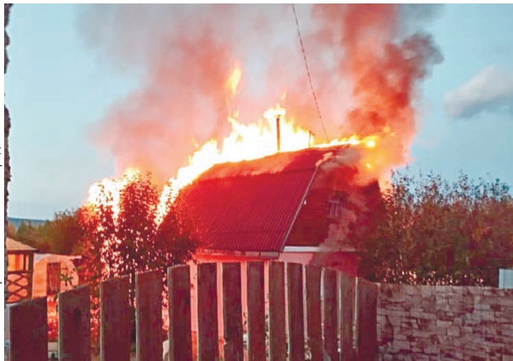
Фото 46-пожарно-спасательный отряд

— При пожаре хозяин садового дома получил отравление продуктами горения. Он доставлен городскую больницу и некоторое время находился в реанимации, —