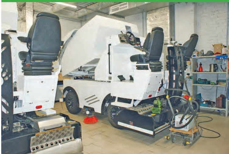
Один электрокомбайн подготавливает лёд за 15 минут