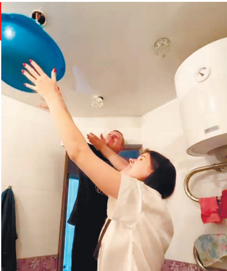
Скриншот с видео. Пытались собрать воду с выключателя, как так видели, что туда капает, и вода в лампочке собирается. Но ее было настолько много, что вода разлилась и побежала из другого отверстия в потолке

Через удлинители жители вынуждены тянуть электричество из кухни в зал, чтобы включить освещение, телевизор, телефоны зарядить. А спальня стоит без электричества уже несколько месяцев.