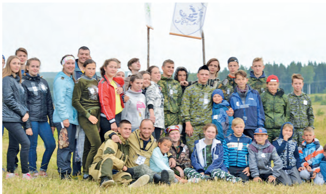
Православная молодежная организация «Феникс» (архивное фото)

Молодёжь православного храма во имя Воскресения Христова организовала вечер встречи в честь десятилетия православной молодежной организации «Феникс».