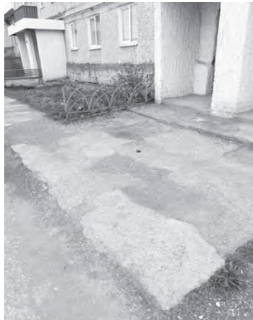
Второй год просим заасфальтировать этот участок

Моё заявление было принято, подписано. Мне сказали, что в июне привезут землю. Звоню в июне. Там удивляются: «А почему вы в июне ждёте? Это в планах на весь летний период». Проходит июль, начинается ав-