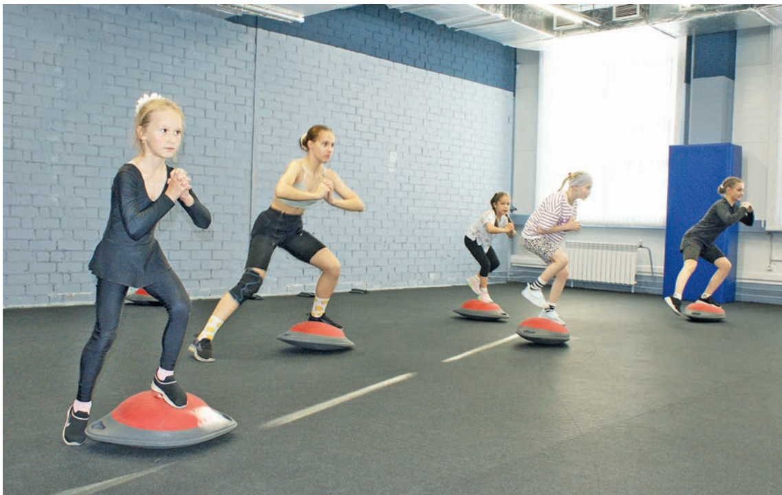
После тренировки на льду фигуристки идут в фитнес-зал