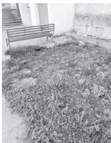
Газон завален камнями и проваливается

По этому поводу 25 апреля я написала заявление в управляющую компанию куратору Олеся Михайловне с просьбой привезти землю на газон и забетонировать площадку перед входом в 7 подъезд, потому что весь этот шлам тянется в кварти-