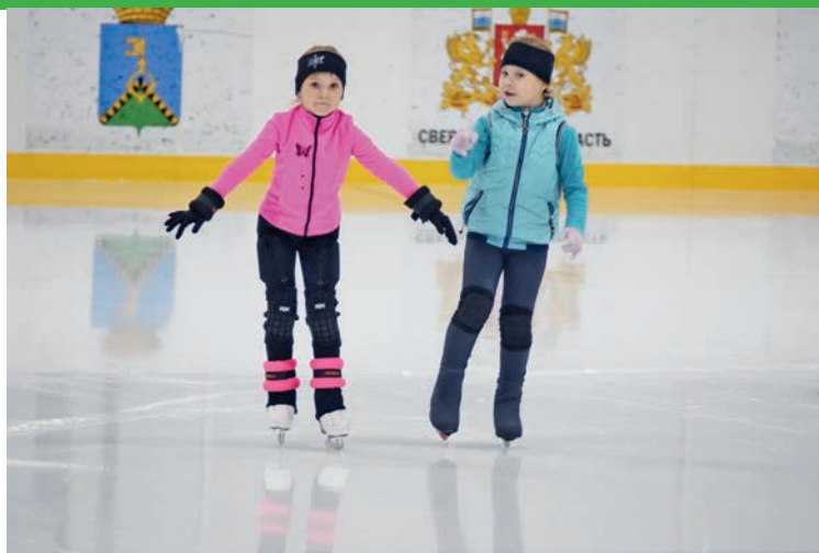
Юные спортсменки с удовольствием приходят на тренировки

нас появится тренер по хоккею, или в спортивной школе откроется отделение по хоккею, то мы зачислим наших хоккеистов из группы здоровья в ранг спортсменов, появится команда, которая сможет ездить на соревнования. Ждём желающих.