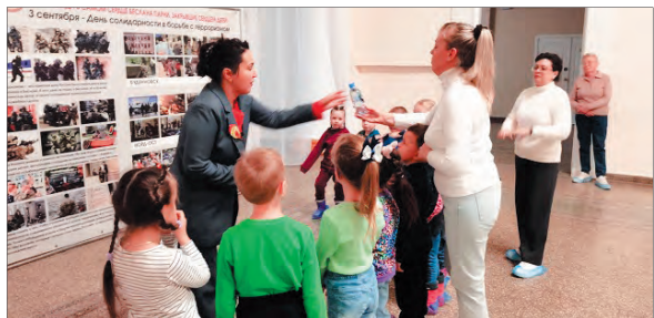
Урок памяти для дошкольников в музее Дегтярска

1 сентября — праздничный день, дети идут в школу, где звучат первые звонки на торжественных линейках. В такой же день 21 год назад такая же линейка завершилась трагедией, о которой даже спустя годы забыть не получается: здание школы № 1 города Беслан захватили террористы. Два с половиной дня они удерживали в здании 1128 заложников — сотрудников школы, детей и их родителей, пришедших на праздник. Освободили их только на третий день, после штурм здания, в результате теракта погибли 344 человека. Каждый год мы вспоминаем эту трагедию. 3 сентября в России установлен День солидарности в борьбе с терроризмом. Памятная дата была установлена в 2005 году и связана с трагическими событиями в городе Беслане.