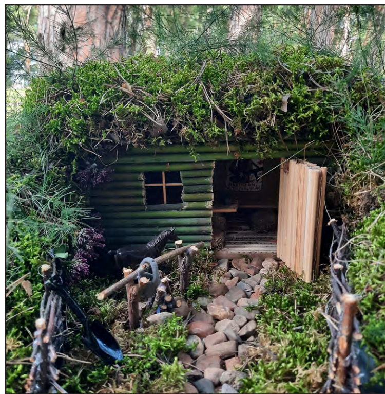
Землянка клуба «Надежда»