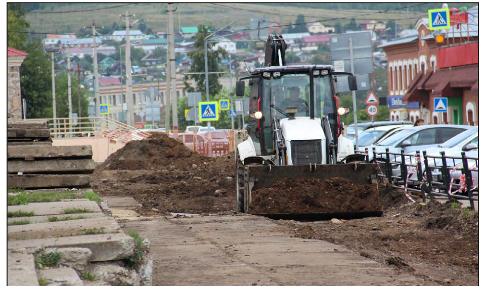
Работы по замене водопроводных сетей на улице Ленина в п. Арти

два км из них – ветхие. На сегодня проведены испытания на прочность и плотность для выявления дефектов теплосетей, промывка системы теплоснабжения, гидравлические испытания, проверка запорной арматуры потребителей теплоэнергии. Необходимо обеспечить подготовку спецтехники ЖКХ к работе в зимних условиях, обеспечить котельные независимыми источниками электроснабжения (перекидными рубильниками, дизельгенераторами), выполнить работы по подготовке жилфонда и внутренних инженерных сетей