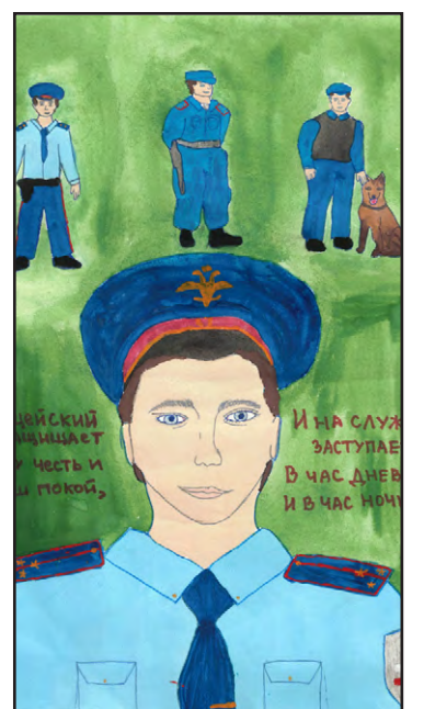
Конкурсная работа прошлого года