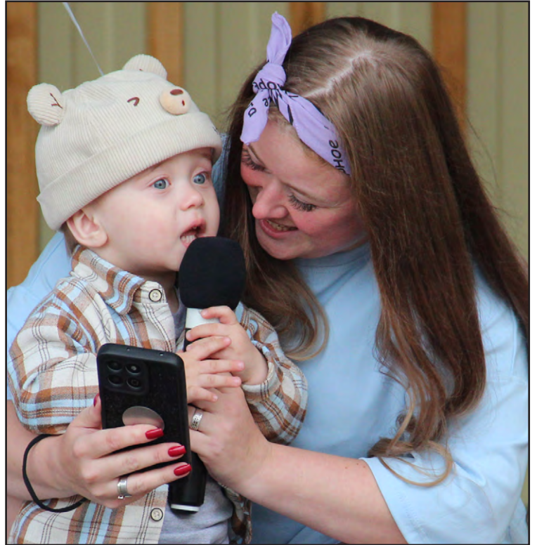
— Я тоже хочу рассказать про свою бабушку!