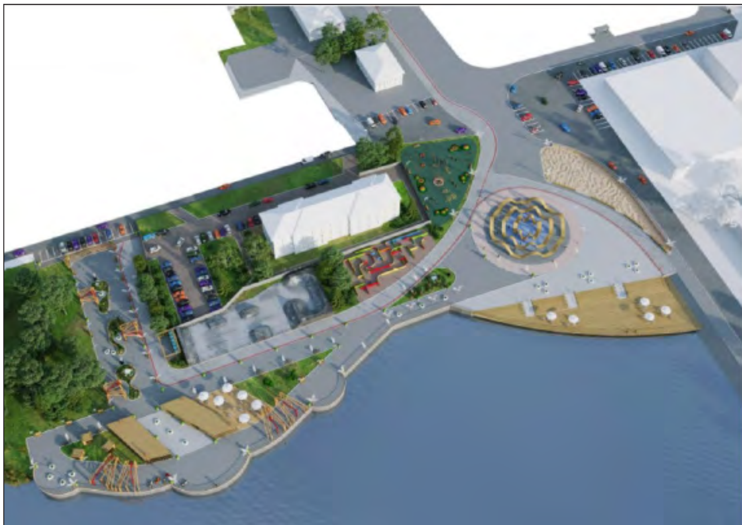
Набережная у Артинского пруда (проект)