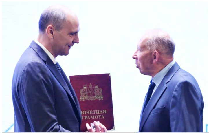
Д.В. Паслер и С.Н. Горбунов

- Сегодня в системе образования региона трудится более 78 тысяч человек, из них 38 тысяч - в школах, лицеях и гимназиях. Каждый учитель - это пример для подражания, человек, заслуживающий огромного уважения и признания. Это терпеливый, ответственный и мудрый на-