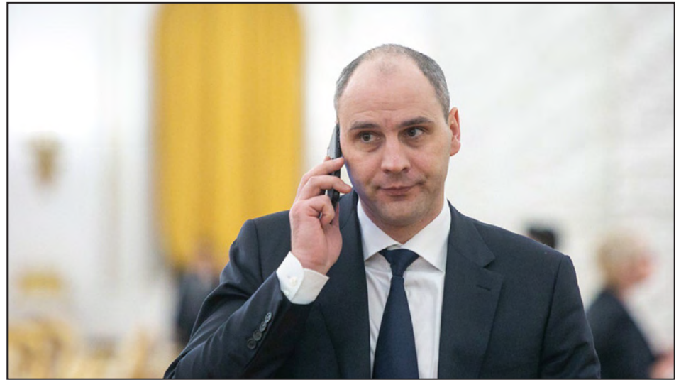
Денис Владимирович Паслер

В Артинском муниципальном округе полным ходом идет подготовка к отопительному сезону. Десять предприятий поставляют комуслуги потребителям, из них три муниципальных. Жилфонд и соцсферу отапливают 71 котельная (50 - муниципальных: на твердом топливе - 15, газовых - 11, электрических - 24; 21 - ведомственная). Протяженность теплосетей - 17,57 км,