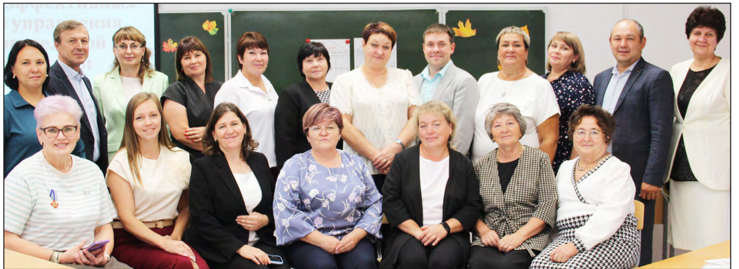
Участники секции «Модели управления и экономика образования»

«Общее образование»: здесь выработывали управленческие решения на уровне муниципалитета, призванные выстроить систему выявления и под-