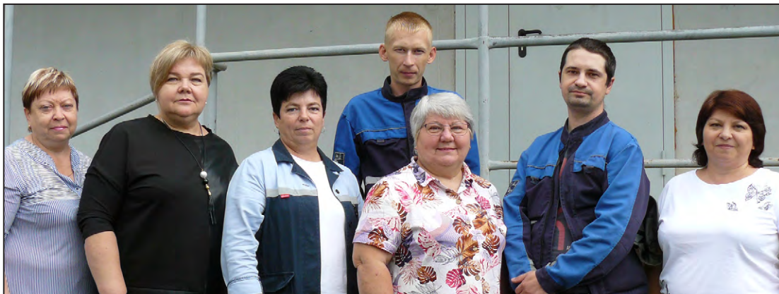
Коллектив газового участка.

Молодой коллектив газовиков на лидирующей позиции в работе, спорте, творчестве