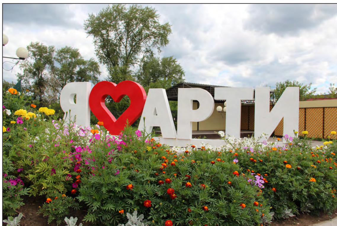
Парк культуры и отдыха им. 1 Мая