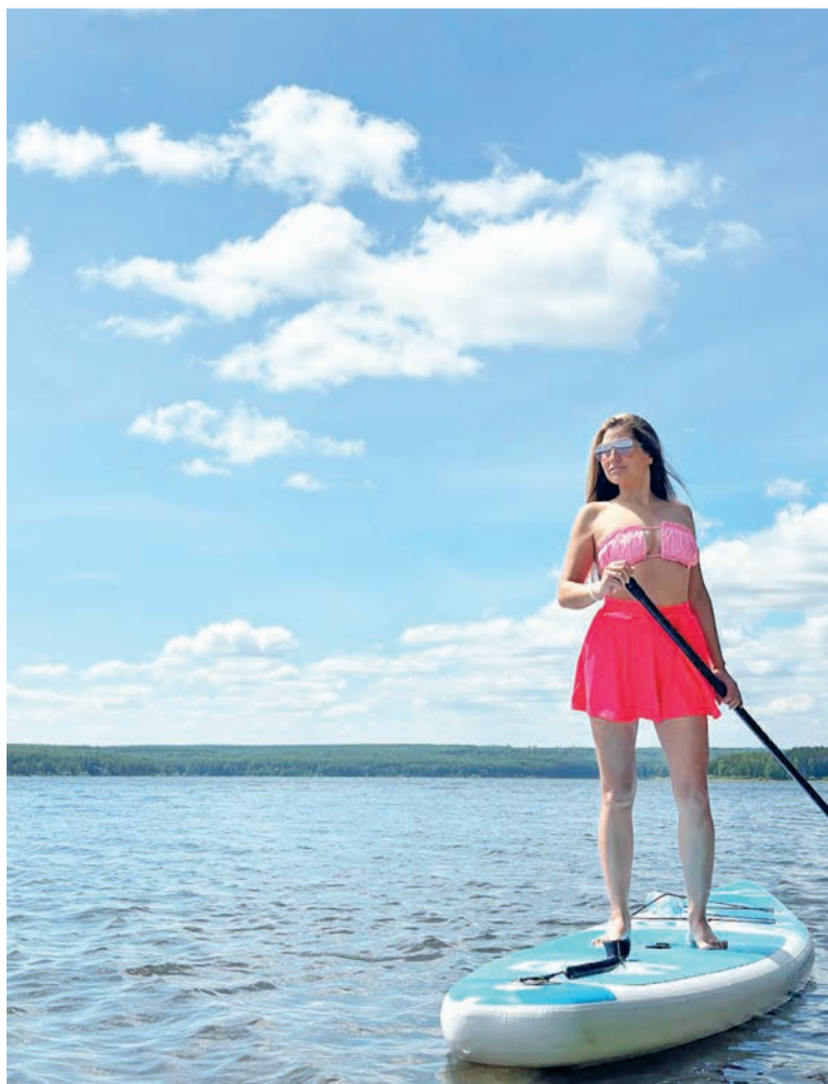
Каждый день — это подарок, его нужно использовать по максимуму