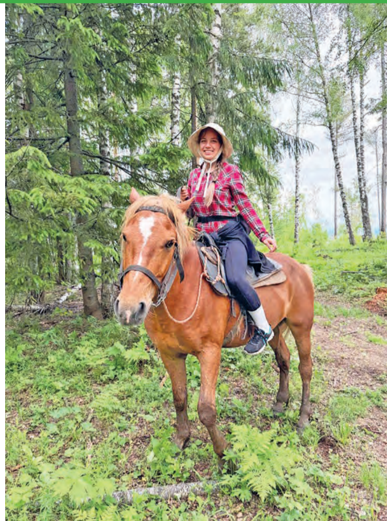
Поход в Башкирии