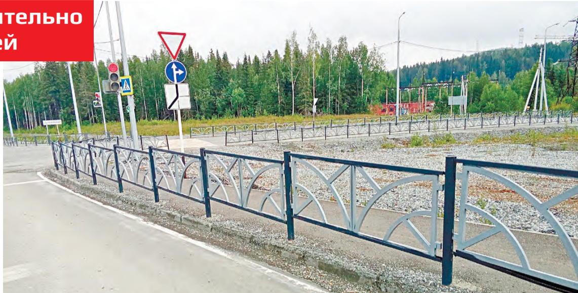
Покраска лишь периметра секции (без пластикового вкладыша) обошлась городскому бюджету всего в 679 рублей. Недорого

Период выполнения работ — с даты подписания договора по 30 июня текущего года. И если техническое задание к контракту более-менее понятно, то, посмотрев смету, понимаешь — мутноватая история с этими загородками. С покраской всё понятно: работы плюс краска — это 185 364, 8 рублей. Объем работы — 409 м 2 . Стоимость 1 квадратного метра — 453 рубля. Площадь 1 секции 1,5 кв.м. Итого, 1 секция забора обходится бюджету в 679 рублей. Краска стоит недорого. Так