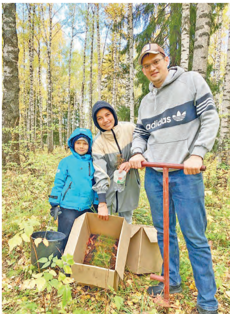
Семья Обатниных активно участвует в жизни города

В четверг мне пришли результаты, а в субботу я уже