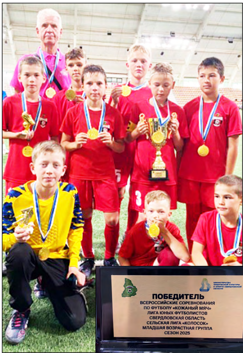
«Золотая» команда «Красногорец»