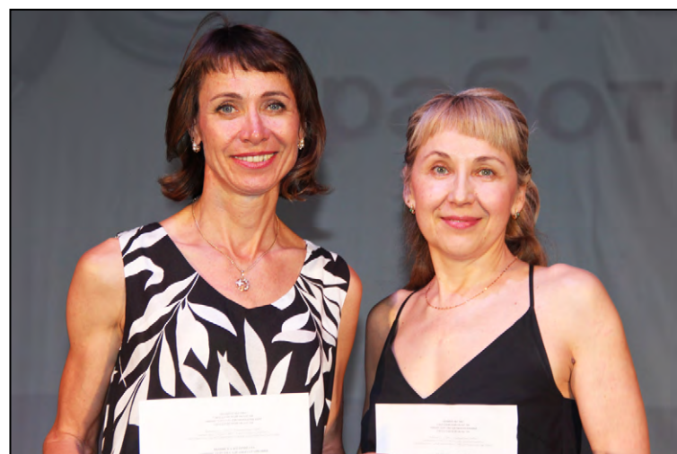
Л.В. Макарова и О.В. Рухмалева.