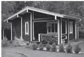
Реклама ИНН 665813768240