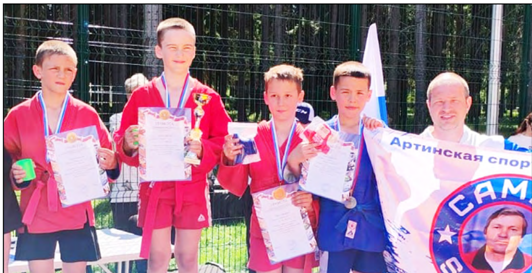
Весь пьедестал - артинский