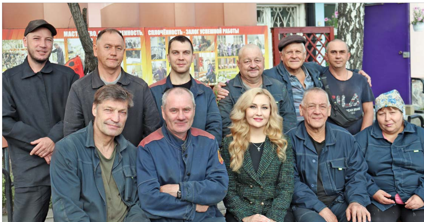
Почти в полном составе. Утренняя разнарядка завершилась, впереди рабочая смена.