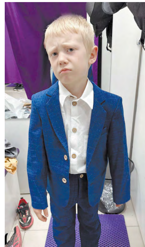
Режевлянин Семён «тоже рад» встрече со школой.

И вот – до первого сентября осталось чуть больше недели! Теперь поставлена главная цель: настроиться на учебный год. И наконец принять тот факт, что наши дети уже не малыши. Они – первоклассники! Ребятам предстоит впервые прийти на уроки, делать домашние задания, отвечать у доски, проводить время в новом коллективе, получить первую пятерку, а возможно – и двойку. Произойдет много всего. Поэтому, уважаемые родители, не переживаем,