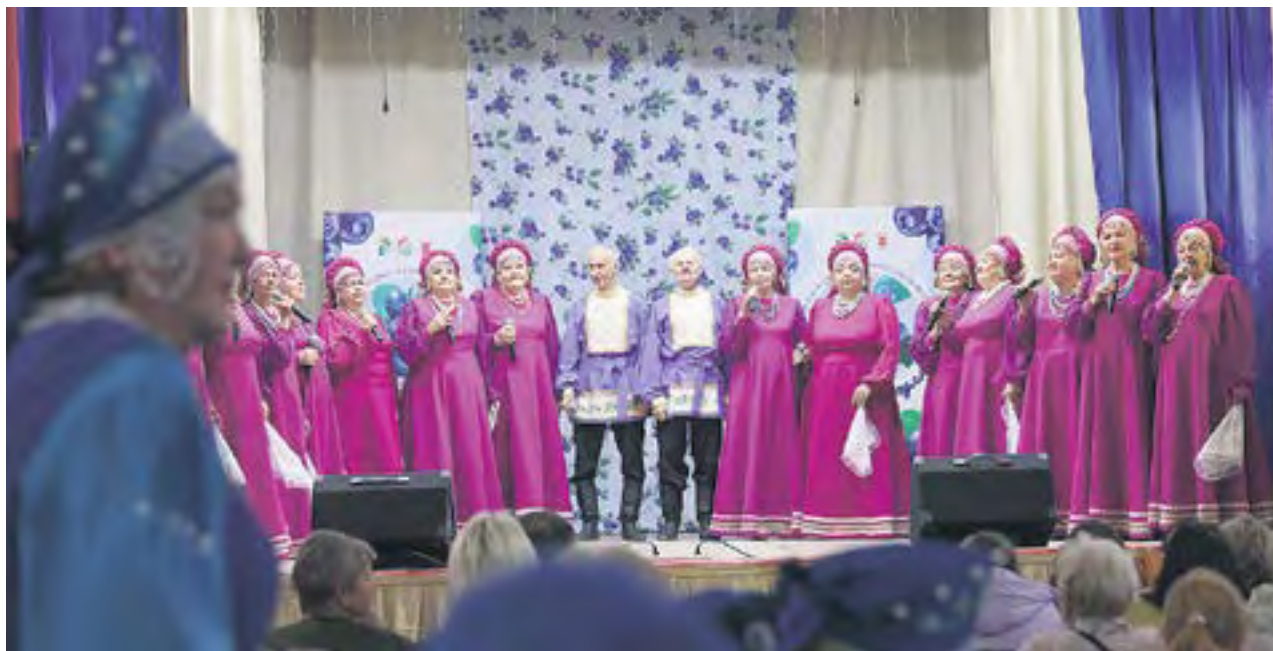
Из-за погоды концертную программу перенесли в стены ДК Мариинска.