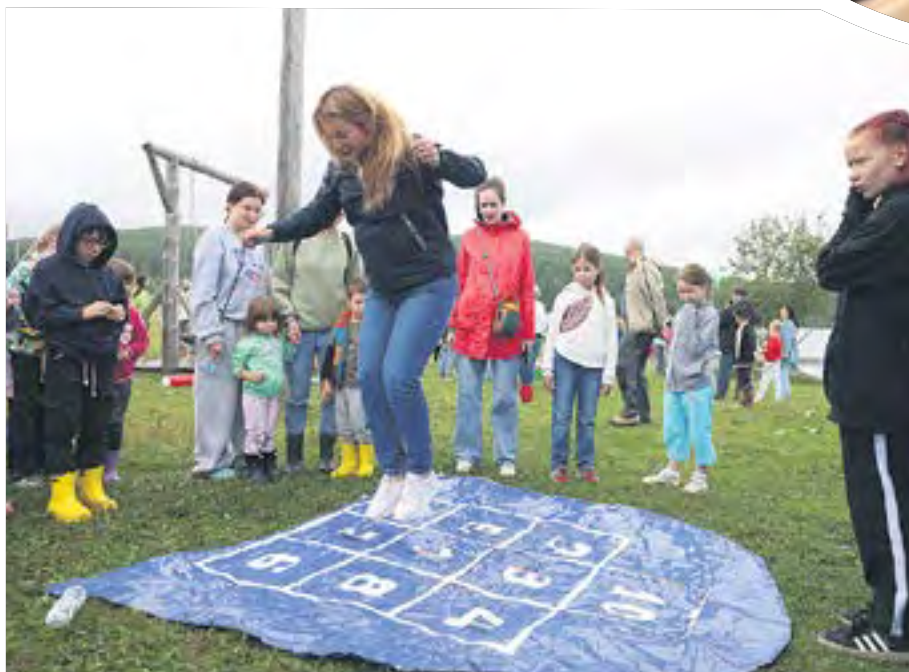
В играх и конкурсах принимали участие как взрослые, так и дети.

Лучшие моменты фестиваля в нашем фоторепортаже.