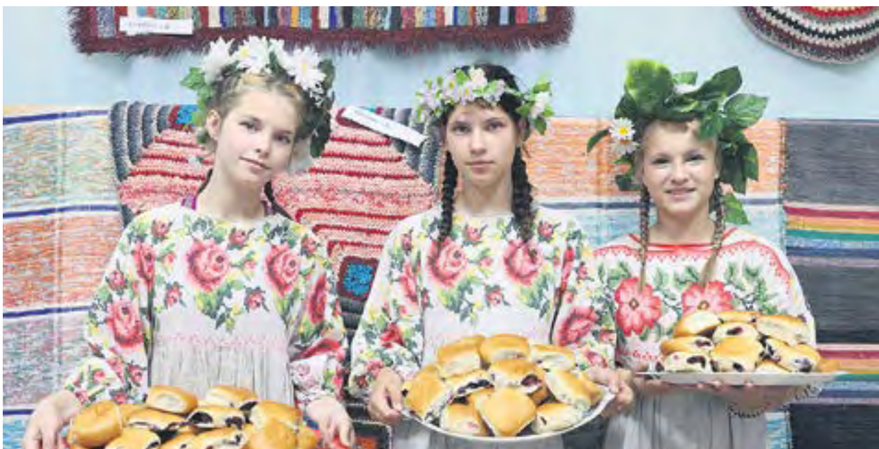
В конце праздника гостей угощали вкуснейшими пирогами с черникой.