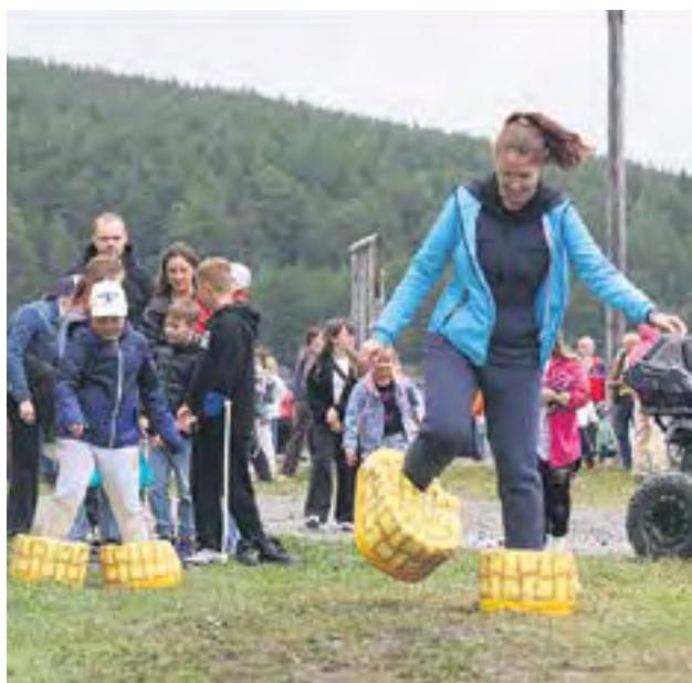
Поиграть в активные игры можно было как в специальном шатре, так и на свежем воздухе.