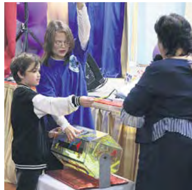
Все желающие могли попытать счастье в лотерее и выиграть интересные призы.