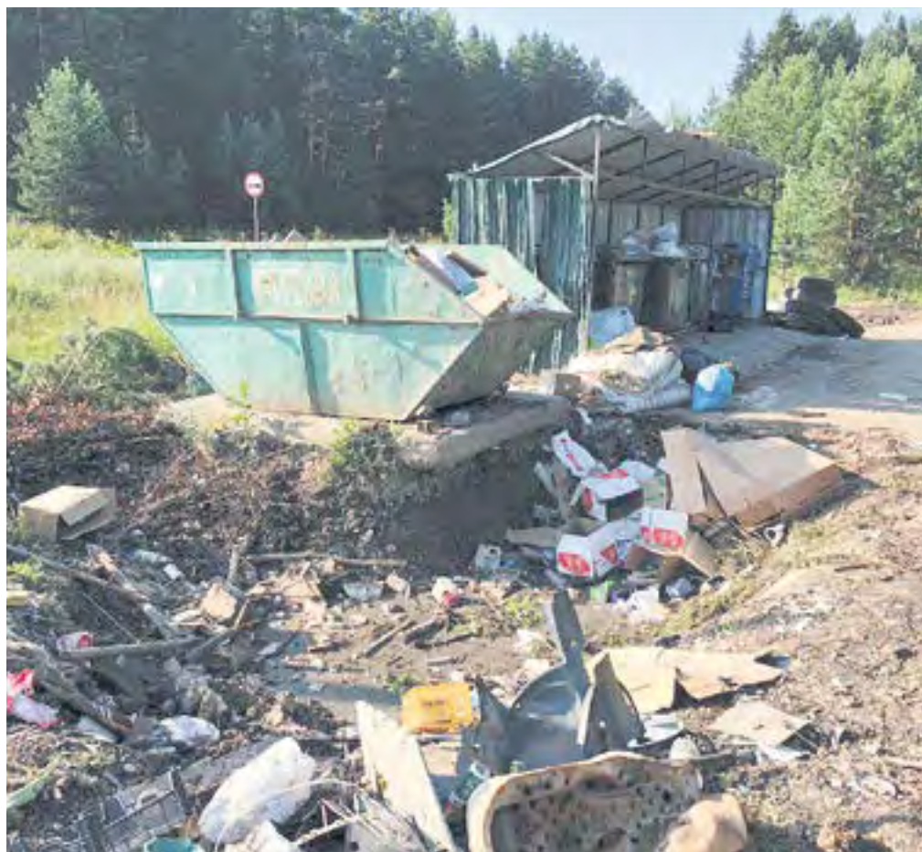
Вот такая ситуация сейчас на контейнерной площадке на улице Сосновой. Власти, жители и регоператор по очереди обвиняют друг друга. Чище от этого не становится.

— Мы сформировали тарифный отдел, получили средства на производственно-хозяйственную деятельность, сейчас набираем штат. Собираемся провести инвентаризацию для того, чтобы понимать ситуацию. Мы понимаем, что у нас должен быть резерв своего контейнерного оборудования, чтобы не допустить никакого социального напряжения.