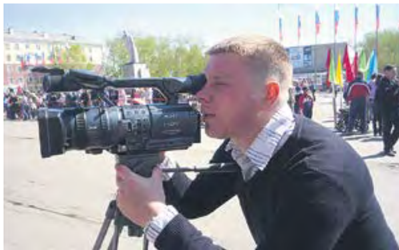
Оператор Андрей Бессонов. // Фото из архива редакции