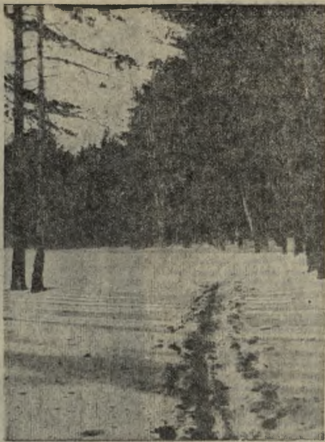
Январь в лесу,

Мужчины возраст 45—55 л дистанция 3 км, зачет по 5.