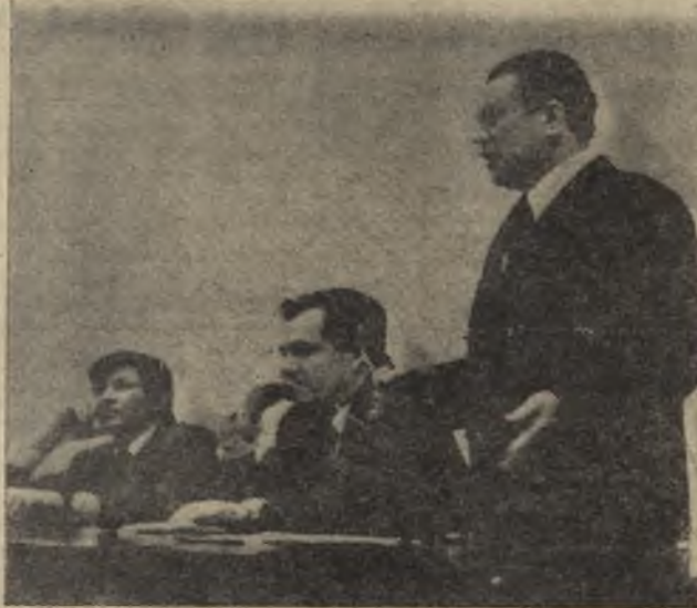
На снимках: во время работы семинара.