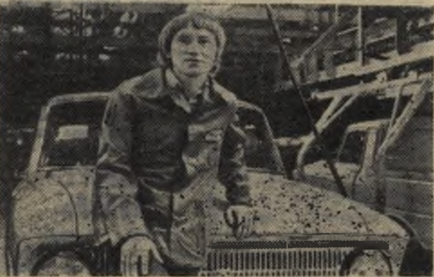
СОВЕТСКОЙ УДМУРТИИ — 60 ЛЕТ

Удмуртской АССР 4 ноября исполняется 60 лет. Бывшая захолустная провинция царской России за годы Советской власти превратилась в крупный промышленный район. Она по праву славится своими легковыми автомобилями и бумагоделательными оборудованием, прецизионными товарными станками и высококачественной сталью.