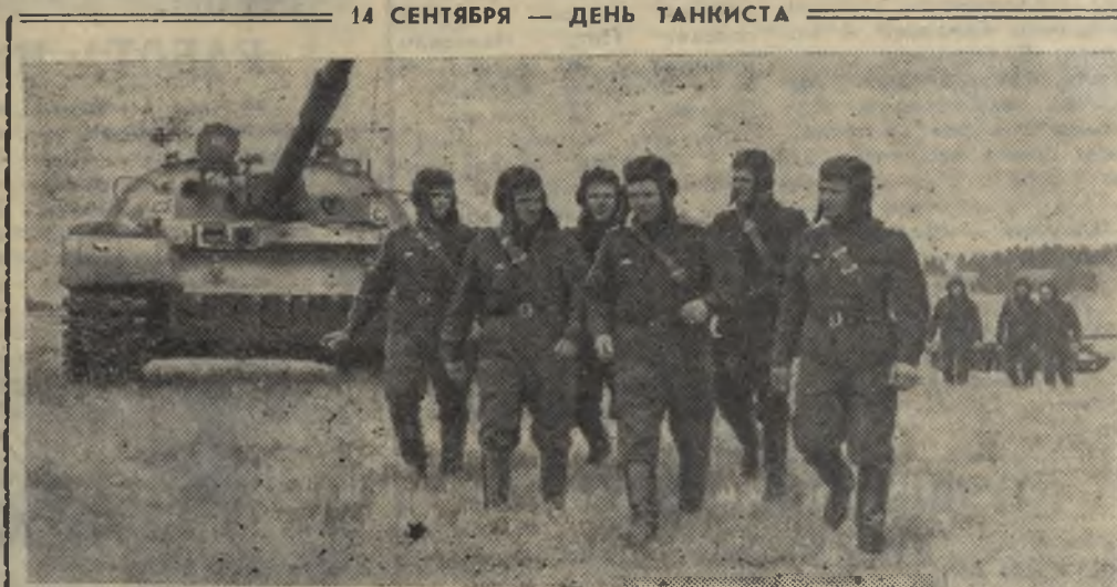
СОВЕРШЕНСТВУЯ БОЕВОЕ МАСТЕРСТВО

Краснознаменный Сибирский военный округ. Воины Н-ской танковой части каждое занятие в поле максимально используют для совершенствования боевого мастерства. Между подразделениями ширится социальное соревнование в честь XXVI съезда КПСС. Хорошие результаты в боевой учебе показывают воины отлично-