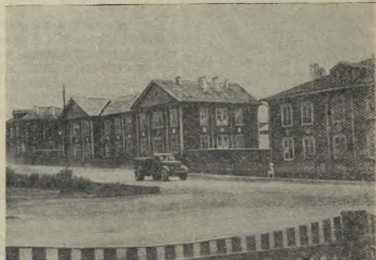
На снимке: город Реж, улица Советская. В этих домах живут рабочие и служащие никелевого завода.