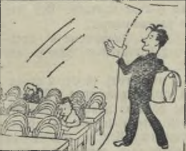
... за списком.