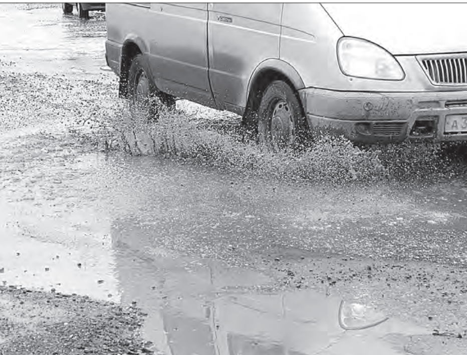
* Улица Кулибина.