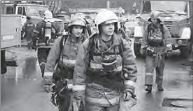
(Продолжение темы — на 4-й стр.)

Предполагается, что все они были нелегальными мигрантами, поскольку официальных документов об использовании иностранной рабочей силы на этом объекте нет. Возгорание в двухэтажном строении, примыкающем к ангару на Качаловском рынке на Варшавском шоссе, возникло вчера около 05.00 мск. Его общая площадь составила 50 кв. м. Само строение, предположительно, было приспособлено под общежитие. В правоохранительных органах предполагают, что причиной пожара могли стать неисправный электронагревательный прибор или короткое замыкание в проводке. Это уже второй крупный пожар в столице за сутки. Вечером 2 апреля возгорание возникло в строящемся небоскребе «Восток» в бизнес-комплексе «Москва-Сити». Пожар начался на 67-м этаже башни, затем пламя перекинулось на 66-й. Два вертолета МЧС и 20 пожарных расчетов боролись с огнем более четырех часов.