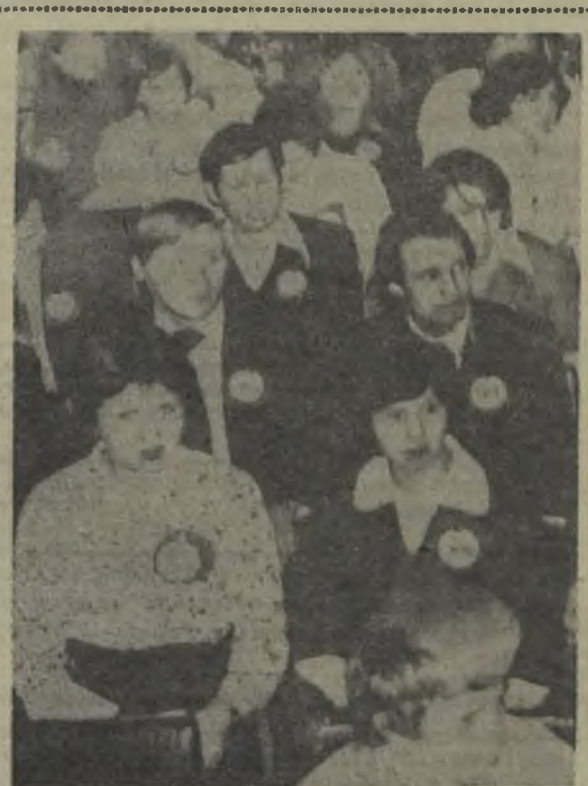
Делегаты городской комсомольской конференции.